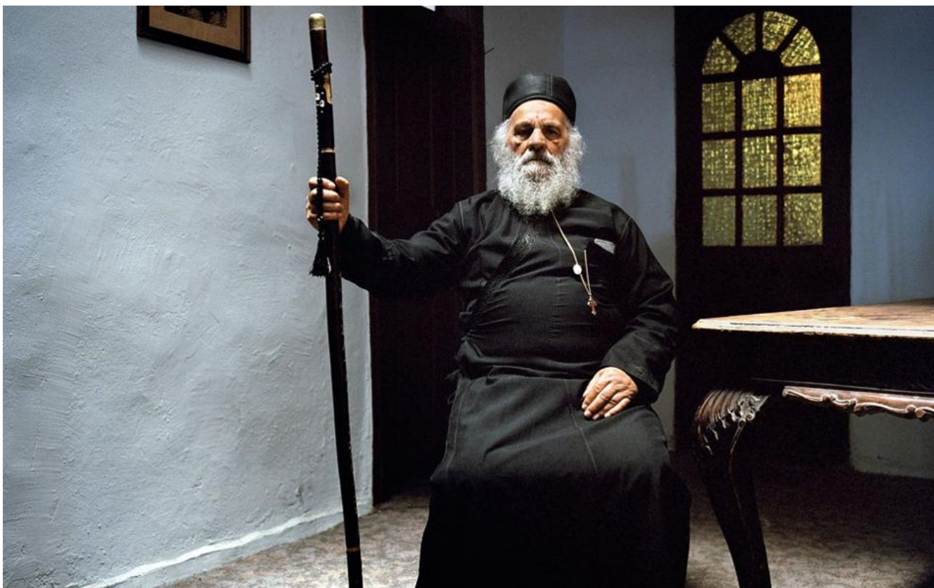
Фотографии Стратоса Калафатиса

В 120 отобранных фотографиях выставки посетители открывают очарование горы Афон, который представлен с большой чувствительностью и художественным мастерством.