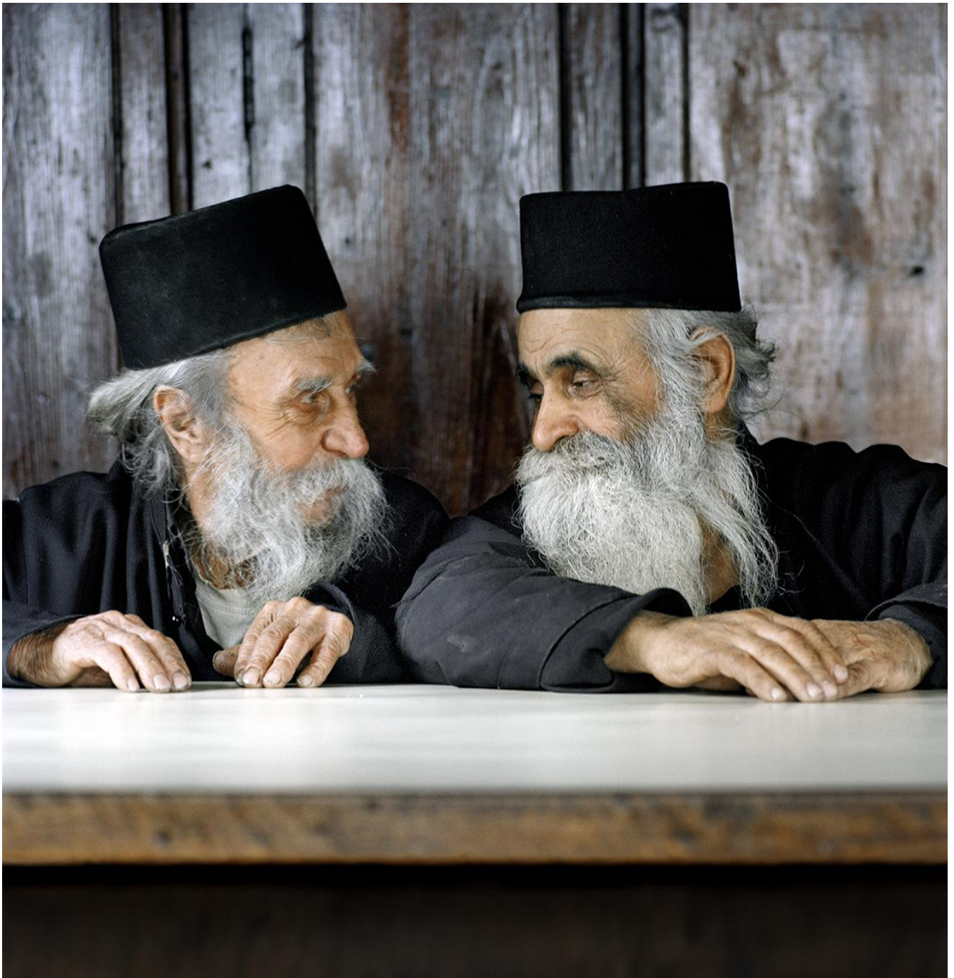
Фотографии Стратоса Калафатиса

Стратос Калафатис сосредоточен на глубине души, эмоциях, лицах, деталях повседневной жизни, медленном течении времени, контрасте между богатым интерьером и бедностью аскетов.