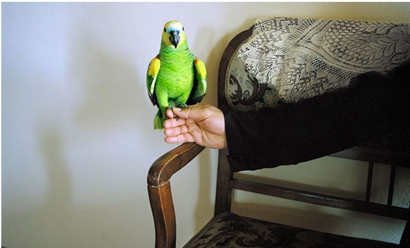
\ Nemo enim ipsam voluptatem