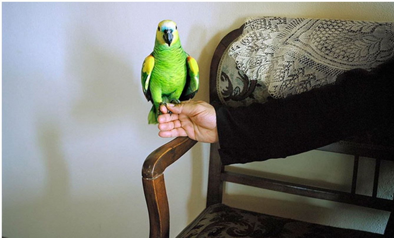
\ Nemo enim ipsam voluptatem