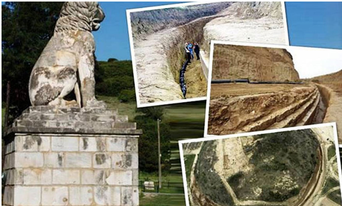
фото : Manwlis \ Nemo enim ipsam voluptatem

Археологи утверждают, что в результате продолжающихся раскопок на территории Амфиополиса, они обнаружили дополнительную гробницу, скрытую под основным захоронением времен Александра Македонского.