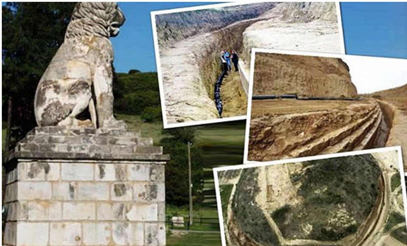
фото : Manwlis \ Nemo enim ipsam voluptatem

Археологи утверждают, что в результате продолжающихся раскопок на территории Амфиополиса, они обнаружили дополнительную гробницу, скрытую под основным захоронением времен Александра Македонского.