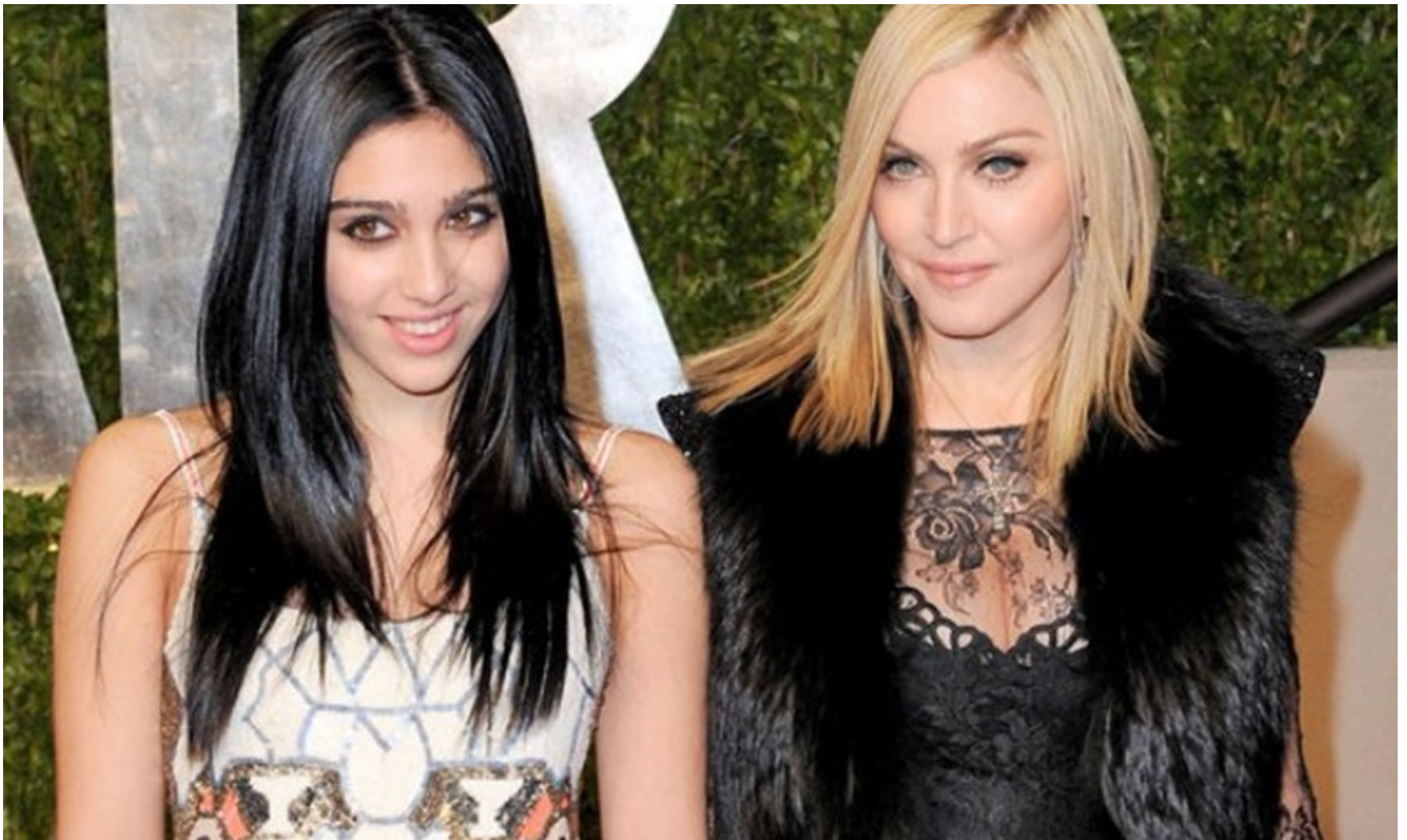
Nemo enim ipsam voluptatem

В Ханье отдыхает дочь Мадонны - 19-летняя Лурдес в сопровождении своего партнёра