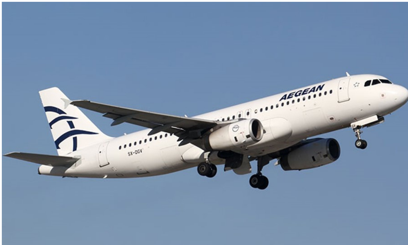
фото : Manwlis \ Nemo enim ipsam voluptatem

Туристическая онлайн платформа tourism-review.com поделилась опросом общественного мнения о главных трендах в туризме в грядущие годы. Его результаты буквально ошеломили, поскольку заядлые путешественники нацелились на каникулы в космосе... и это далеко не самое смелое их ожидание от индустрии отдыха.