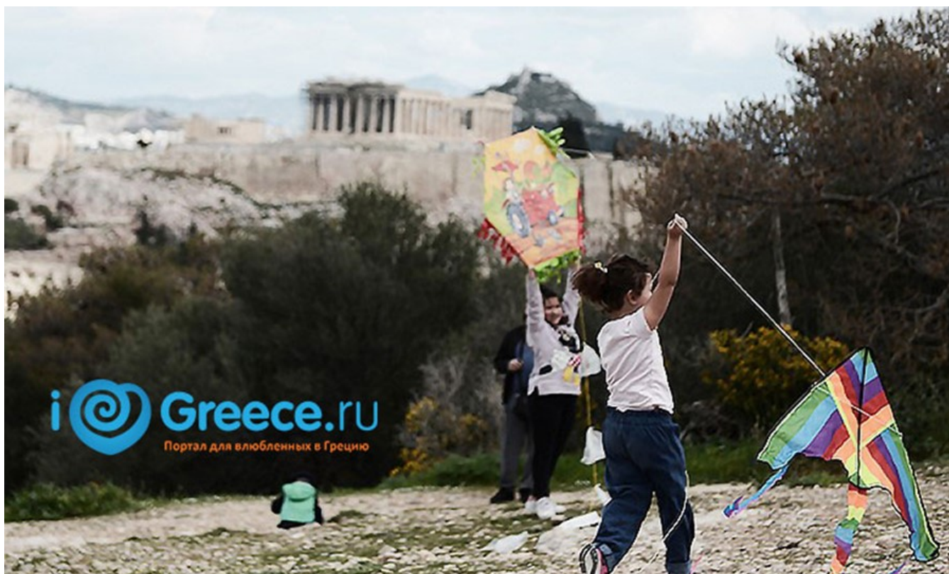
фото : Manwlis \ Nemo enim ipsam voluptatem

Что делать весной туристу в Греции. Греческий врач о секрете молодости: роль NAD+ и баланса витаминов. Тайны афонских рукописей: неизвестные открытия монахов Святой Горы. Экологические инициативы Греции: как защищают побережье сегодня – об этом и не только в нашей рубрике ТОП новости.