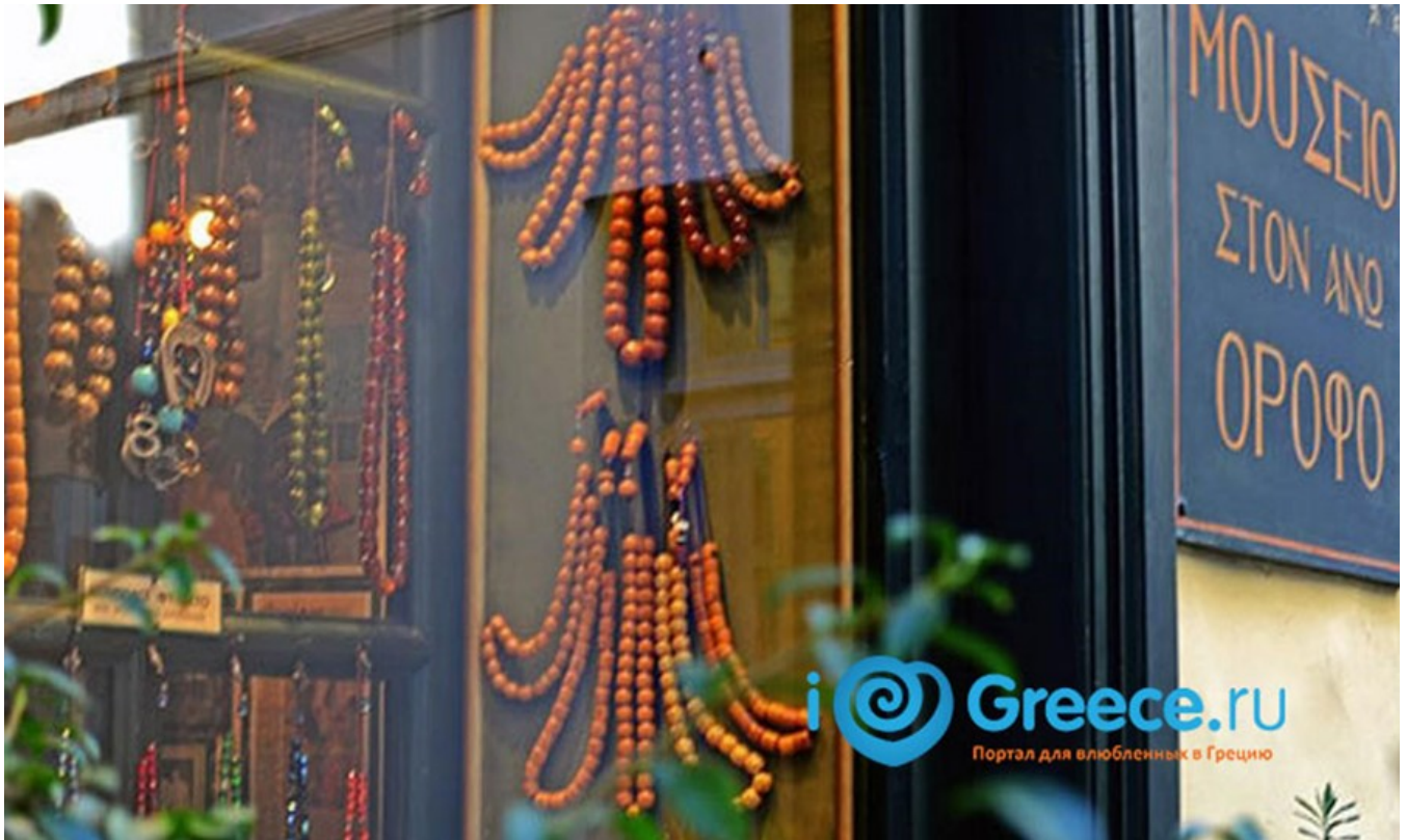
фото : Manwllis \ Nemo enim ipsam voluptatem

Греческие острова вне сезона. Малые музеи Греции — сокровища без очередей. Что производят греческие монастыри — об этом и не только в нашей рубрике ТОП новости