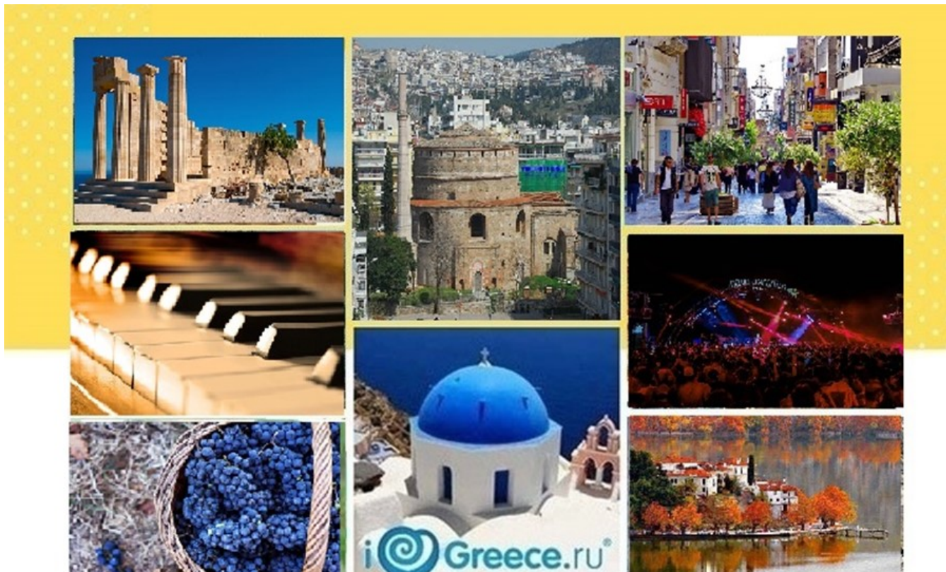
Nemo enim ipsam voluptatem

ТОП 5 горячих ночных точек: куда сходить в Греции в 2023 году Осенние блюда Греции: погрузитесь во вкусы сезона. Золотая осень в Греции: последний шанс на незабываемое путешествие. ТОП самых популярных улиц в Афинах для туристов – обо всем об этом и не только читайте в нашем дайджесте публикаций.