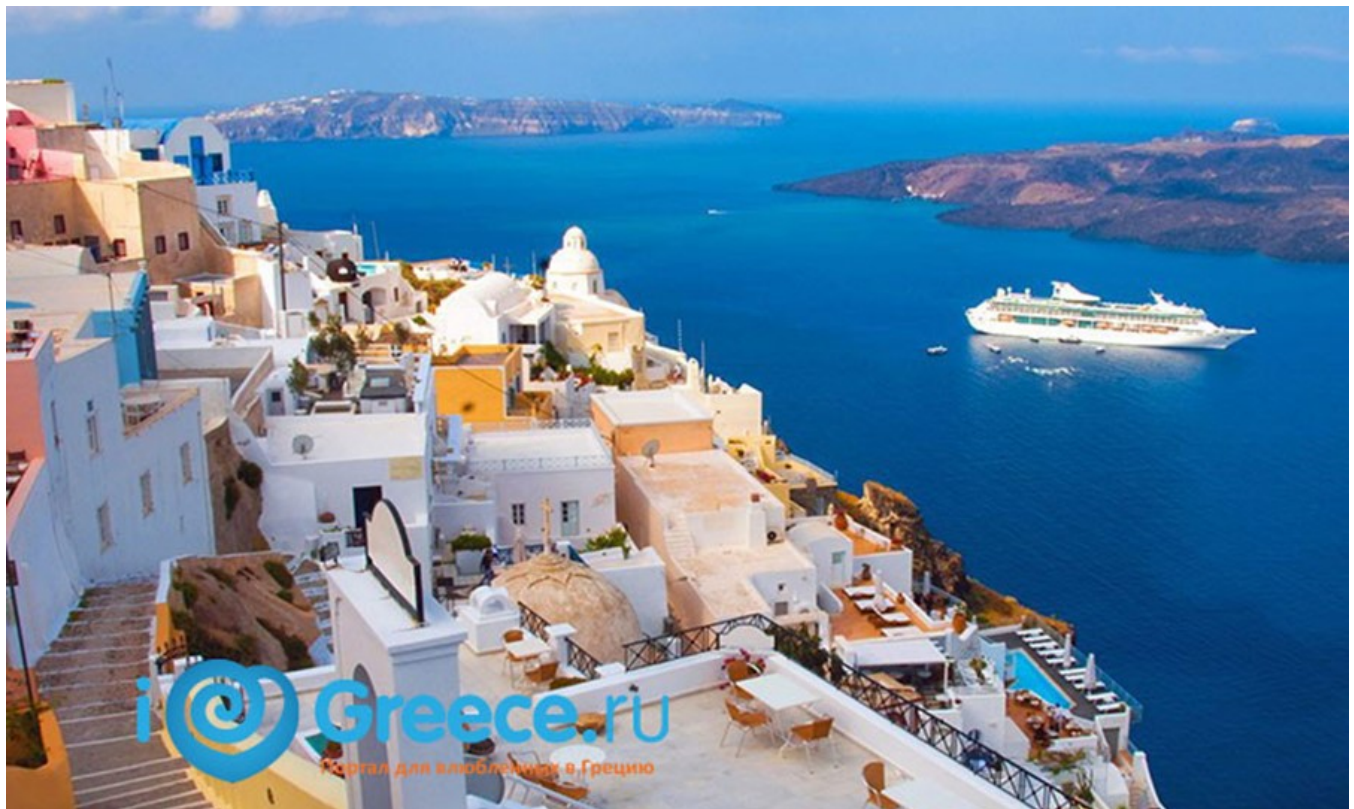
Nemo enim ipsam voluptatem

Греция: пейзажи, которые завораживают, и истории, которые вдохновляют. По секретным уголкам Греции: красота, скрытая от взглядов. Крит стал самым популярным греческим островом по версии пользователей Telegram. Греция: вдохновение для путешественника и историка - обо всем об этом и не только в нашей рубрике ТОП новости