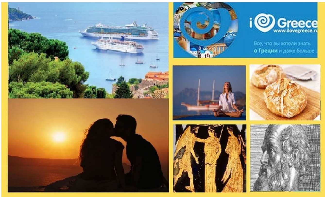
фото : Manwllis \ Nemo enim ipsam voluptatem

Греция привлекает все больше туристов. Жизнь без стресса: путешествия. Уединенный отдых – об этих и о других новостях читайте в нашей рубрике ТОП события!