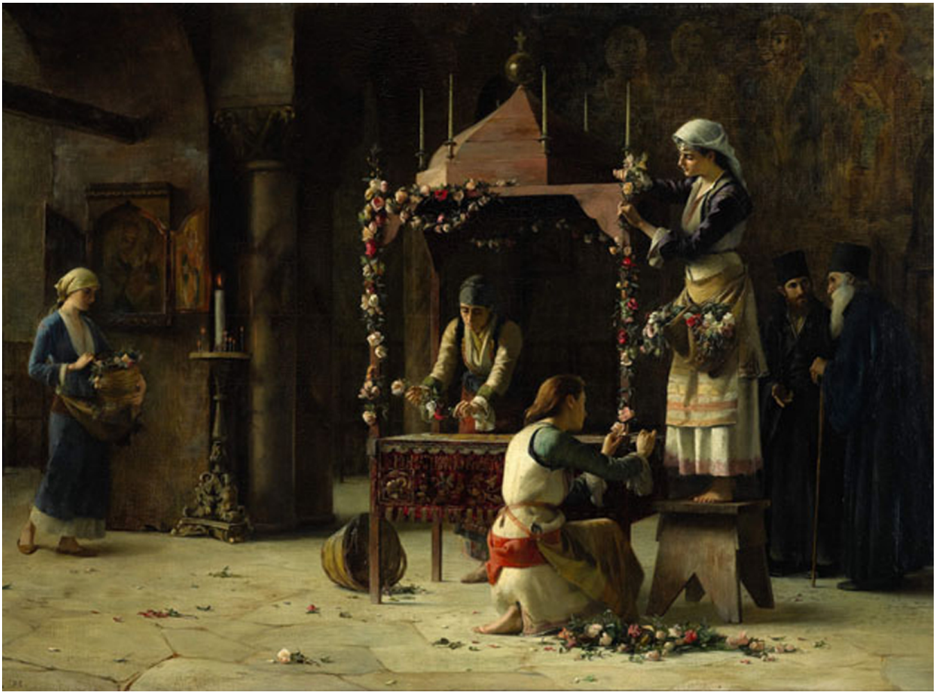
Выставка основана на трех частях: вводные архивные материалы, раздел «Вера в Восток» и раздел «Гарем с ванной» Выставка открыта в музее Бенаки в Афинах до 22 февраля 2015. В субботу, 7 Февраль 2015, выставку можно будет посетить до 14:00.