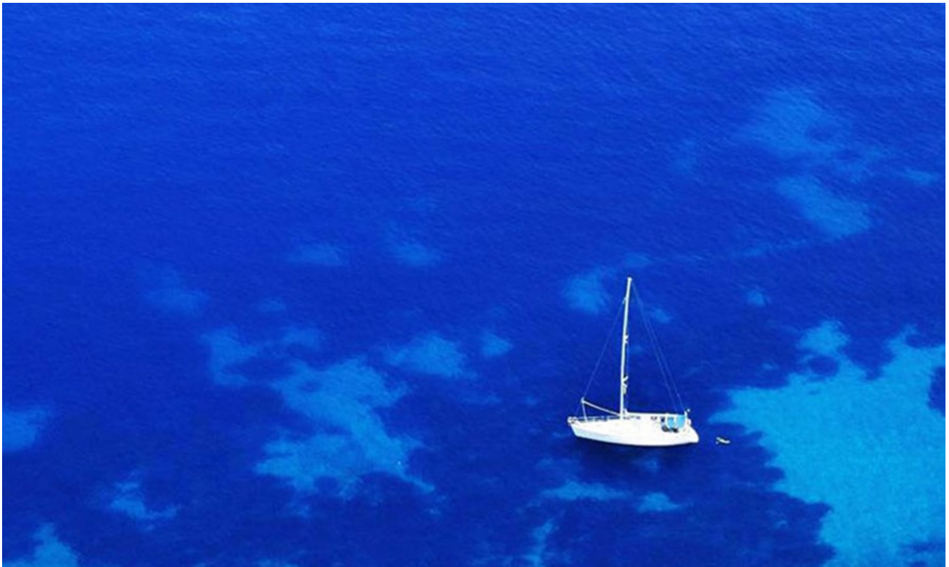
фото : Manwlis \ Nemo enim ipsam voluptatem

Специализирующаяся на популяризации отдыха в Греции организация Marketing Greece запустила новую промокампанию под названием #StaySafe