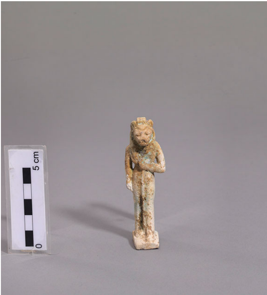
Оберег египетской богини Сехмет из фаянса 790-710 до н.э. Из захоронения А1К1 «воины». Некрополь. Элефтерна, Крит.

Студенты из университета Крита, греческих и зарубежных университетов (Европы, США, Азии, Африки и Австралии) вместе с местными жителями, также принимали участие в раскопках. Археологические находки постепенно проливают свет на историю и традиции города с 3000 г до н.э до 14го века н.э. В результате методичных исследований были обнаружены богатые дома, виллы, дороги, общественные здания, бани, резервуары, бассейны, ограждения, стены, храмы, церкви, печи и мастерские.