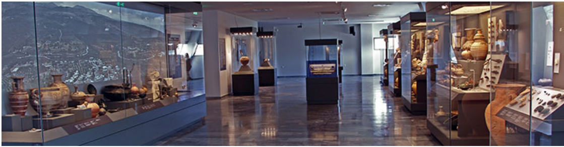
Археологический Музей древней Элефтерны

В воскресенье 19-го июня музей официально откроет Его Превосходительство Президент Греческой Республики, г-н Прокопис Павлопулос, в присутствии ведущих международных деятелей из области политики, науки, бизнеса и искусства.