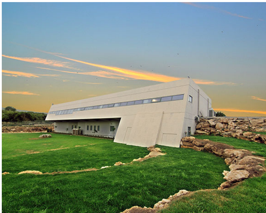
Археологический Музей древней Элефтерны. вид с южной стороны.

Открытие Музея Древней Элефтерны летом 2016 года является самым важным культурным событием Греции.