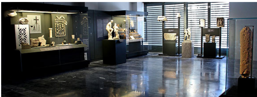
Вид из зала 2, посвященного поклонению святым. От Архаического до раннего византийскому периодам.

В воскресенье 19-го июня музей официально откроет Его Превосходительство Президент Греческой Республики, г-н Прокопис Павлопулос, в присутствии ведущих международных деятелей из области политики, науки, бизнеса и искусства.