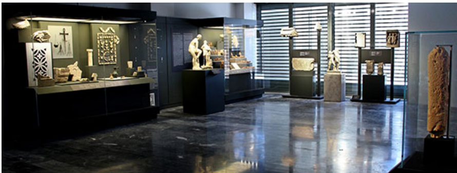
Вид из зала 2, посвященного поклонению святым. От Архаического до раннего византийскому периодов.

В воскресенье 19-го июня музей официально откроет Его Превосходительство Президент Греческой Республики, г-н Прокопис Павлопулос, в присутствии ведущих международных деятелей из области политики, науки, бизнеса и искусства.