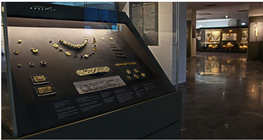
Витрина с драгоценностями. 1 зал.

В Зале 1 - самом большом из трех, содержатся экспонаты, отобранные для первой презентации многовековой общественной, политической, религиозной и частной жизни города Элефтерны. Не маловажны предметы, завезенные из других критских городов и регионов, таких как Аттика, Пелопоннес, Киклады, восточные острова Эгейского моря, Малой Азии, Кипра, Финикии, Сиро-палестинского побережья и Египта.