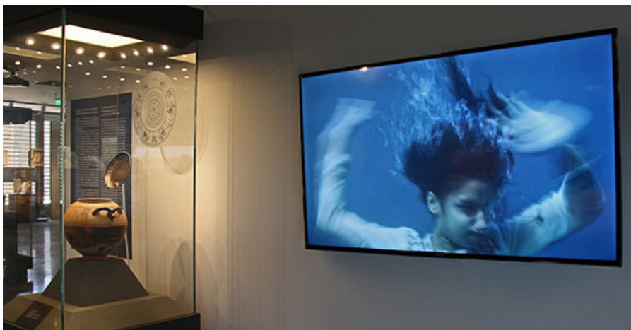
Витрина с кувшином и финикийское блюдо из меди. На экране показ фильма "Phogite", сюжет которого основан на истории Геродота