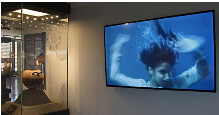
Витрина с кувшином и финикийское блюдо из меди. На экране показ фильма "Phronime", сюжет которого основан на истории Геродота