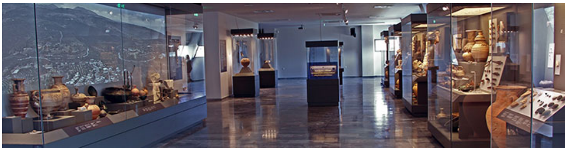
Археологический Музей древней Элефтерны

В воскресенье 19-го июня музей официально откроет Его Превосходительство Президент Греческой Республики, г-н Прокопис Павлопулос, в присутствии ведущих международных деятелей из области политики, науки, бизнеса и искусства.