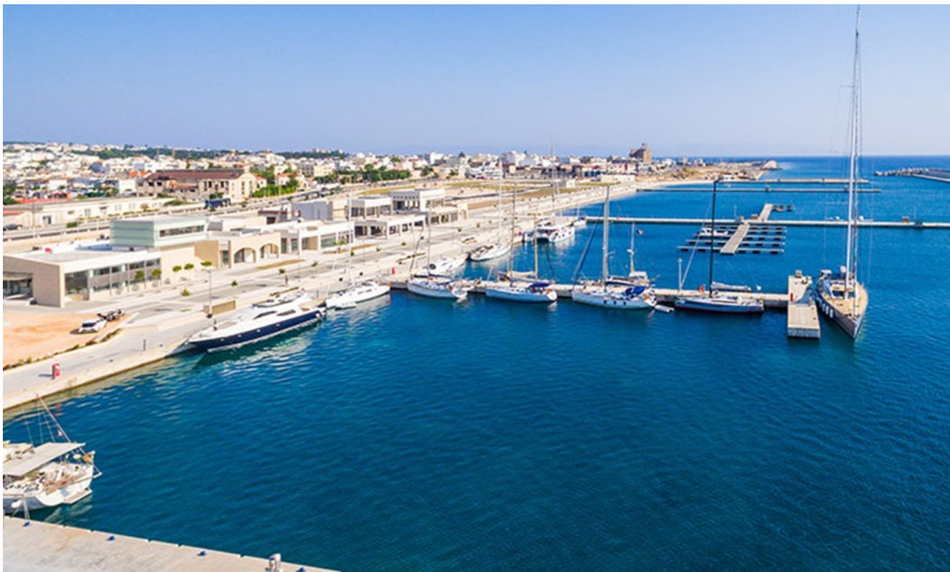
Nemo enim ipsam voluptatem

для острова, Эгейского и Средиземного морей, начала опытную эксплуатацию и уже приветствуется размещение яхт.