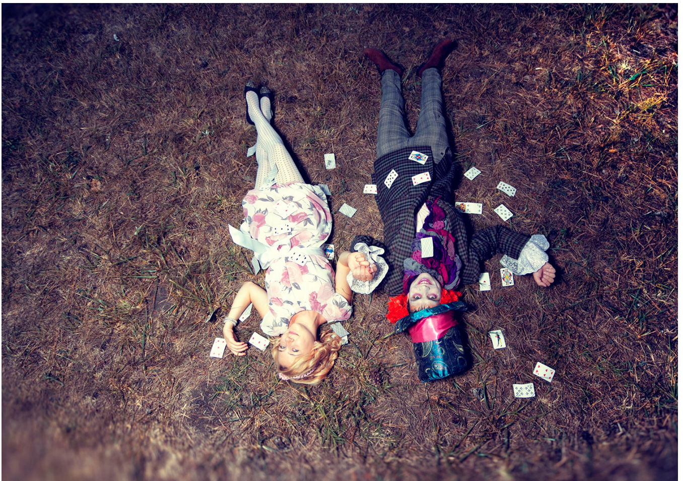
♥my everything Влад & Танюшка / Украина / Романтичное фото