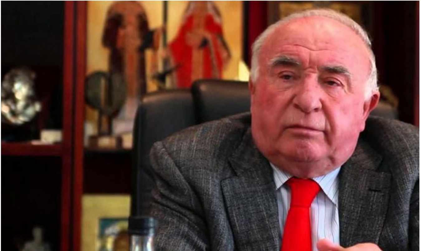
фото : Manwlis \ Nemo enim ipsam voluptatem

28 августа 2016 года в возрасте 80 лет ушел из жизни Константинос Митсис, известный греческий предприниматель, издатель, владелец текстильных фабрик и сети отелей «Mitsis Hotels».