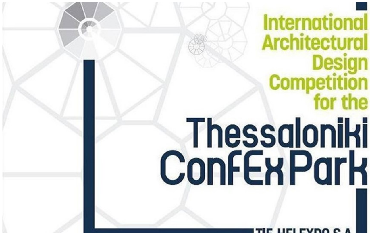
фото : Manwlis \ Nemo enim ipsam voluptatem

Конкурс дизайна Thessaloniki ConfEx Park привлекает международный интерес