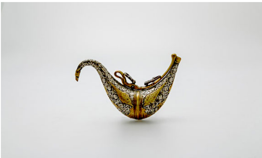
Серебряный и бронзовый сосуд с выгравированным цветочным декором, конец 18 начало 19 века