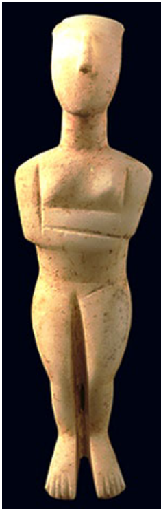
Мраморная женская фигурка со сложенными руками, относящаяся к раннему кикладскому у периоду.