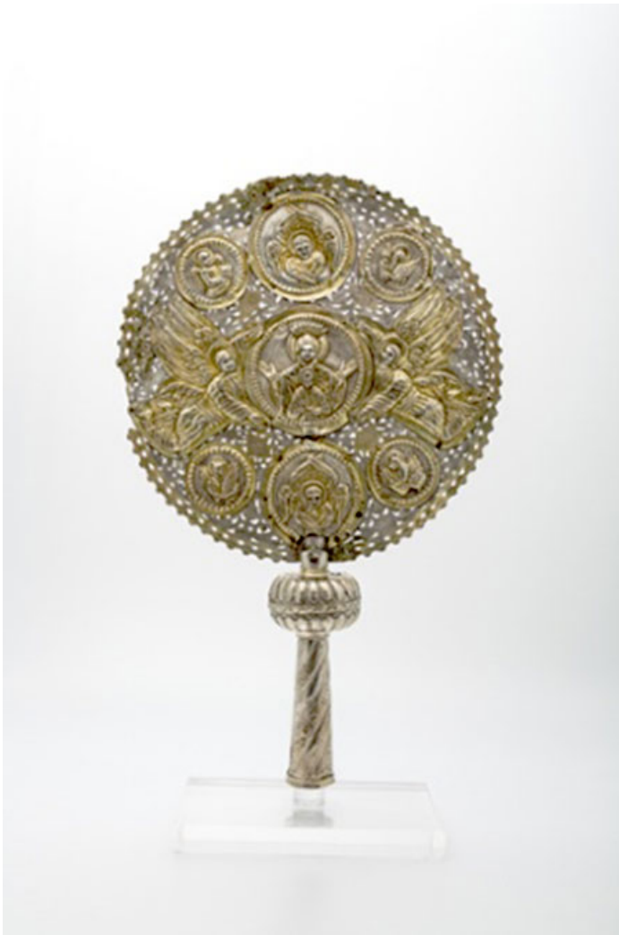
Серебряный диск с медальоном святой и шестью крылатыми ангелами, 18-й век