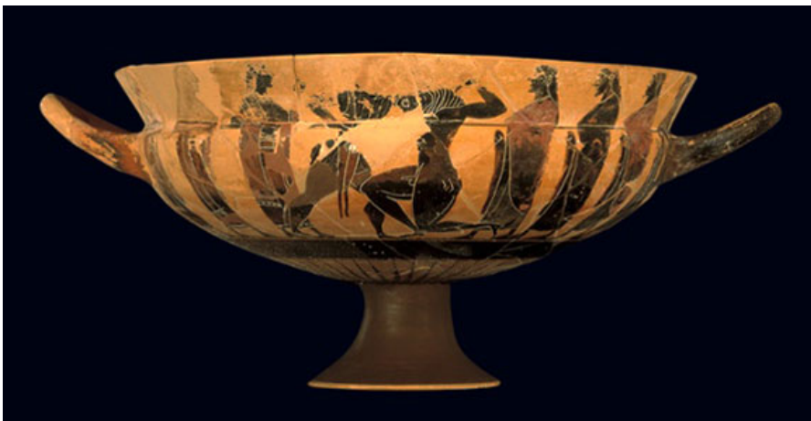
Чернофигурная чаша с изображением борьбы Тесея с Минотавром.