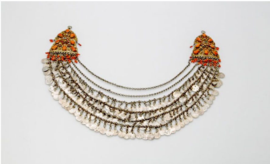
Пектораль с серебряными цепочками и серебряными бляшками, 19-й век