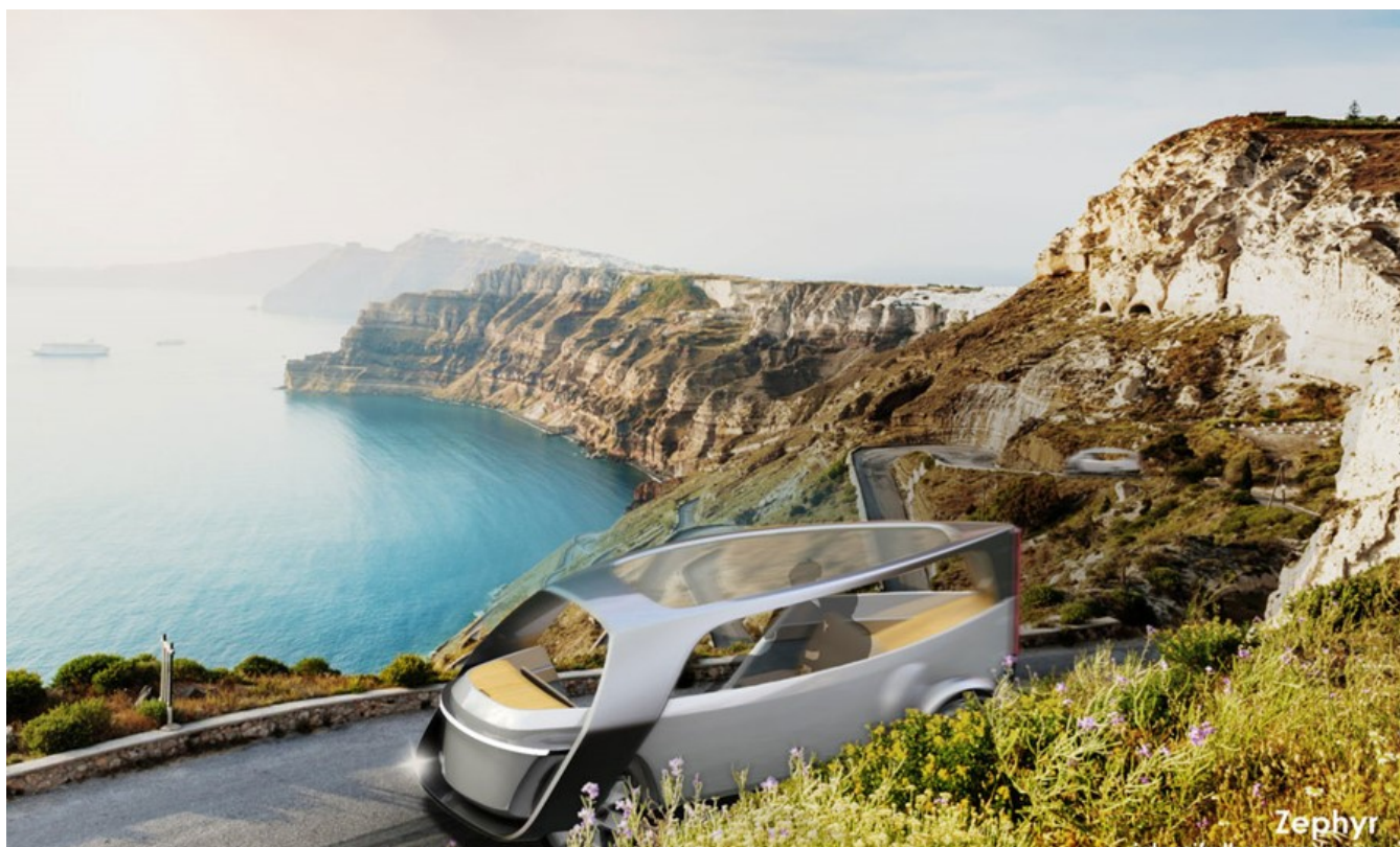
фото : Manwlis \ Nemo enim ipsam voluptatem