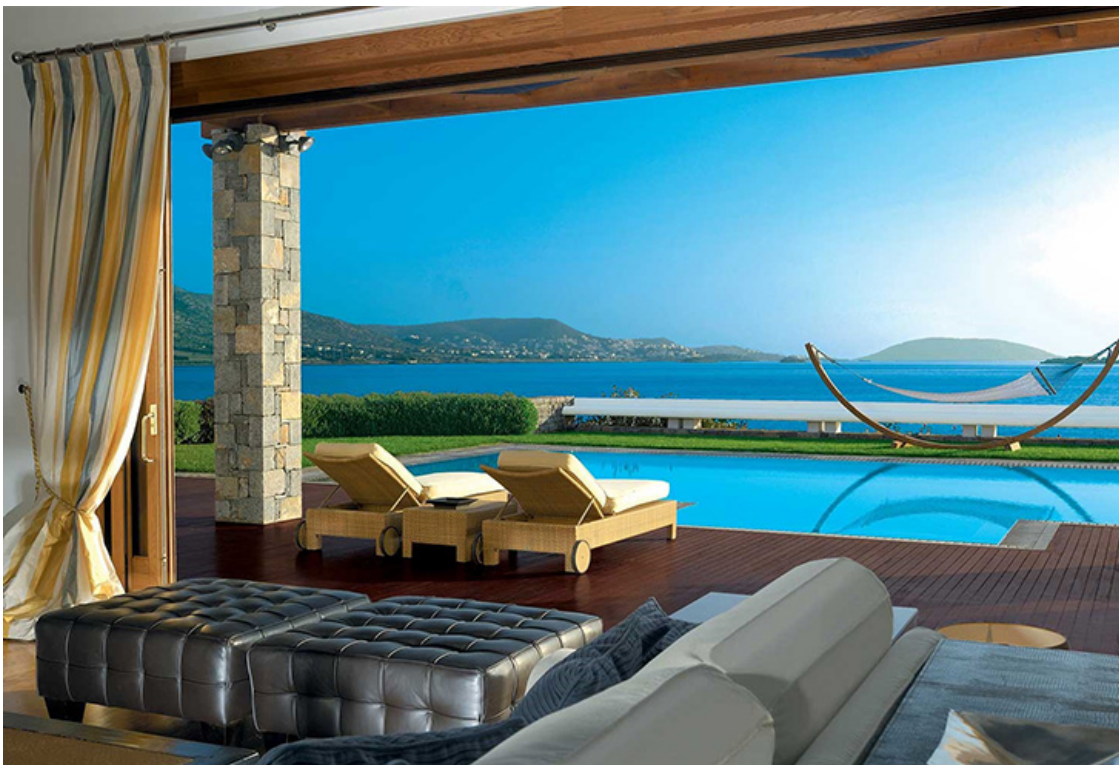
Grand Resort Lagonissi. The Royal Villa

Столь ценимые уважаемыми гостями уединение и приватность здесь уж точно не нарушается ничем — виллы размещаются в уютных местечках, на песчаных пляжах и в частных небольших бухтах, расположенных вдоль всей береговой линии.