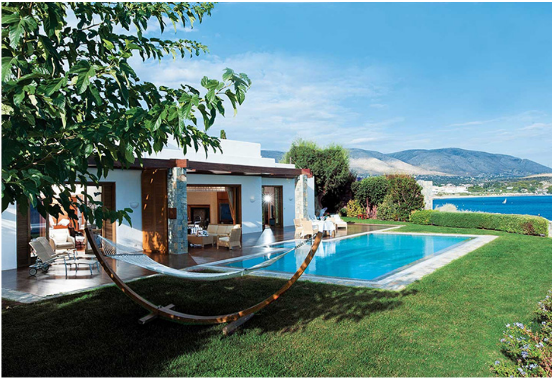
Grand Resort Lagonissi. The Royal Villa

Вилла состоит из двух спален, каждая из которых имеет собственную ванную комнату, отделанную мрамором, а также ванную комнату для гостей, личную столовую и гостиную с системой домашнего кинотеатра и камином, полностью оборудованную офисную комнату. В этом номере, в особой комнате с отдельным входом, проживает также личный дворецкий. На этой вилле есть крытый бассейн с гидромассажем, паровая баня, тренажерный зал и массажная комната, площадка для барбекю. В общем, все для полноценного королевского отдыха и... работы. Тот случай, когда нам просто необходимо совмещать полезное с приятным.