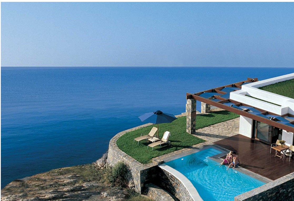
Grand Resort Lagonissi. Belvedere Suite с частным бассейном

А самая высокая оценка для работников отеля – это слова благодарности гостей, которые возвращаются сюда вновь и вновь, или только-только открывают для себя мир Lagonissi.