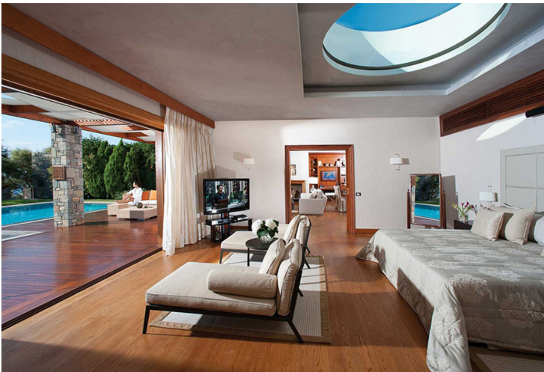
Grand Resort Lagonissi. Dream Suite

Вилла состоит из двух спален, каждая из которых имеет собственную ванную комнату, отделанную мрамором, а также ванную комнату для гостей, личную столовую и гостиную с системой домашнего кинотеатра и камином, полностью оборудованную офисную комнату. В этом номере, в особой комнате с отдельным входом, проживает также личный дворецкий. На этой вилле есть крытый бассейн с гидромассажем, паровая баня, тренажерный зал и массажная комната, площадка для барбекю. В общем, все для полноценного королевского отдыха и... работы. Тот случай, когда нам просто необходимо совмещать полезное с приятным.