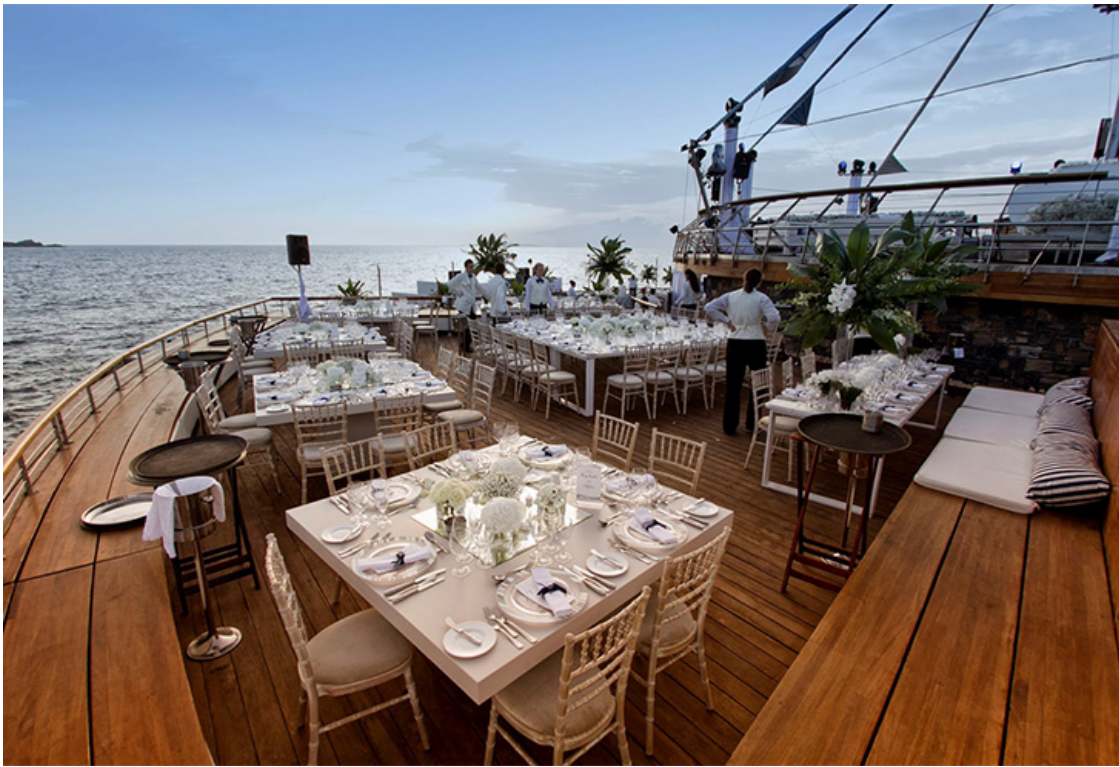
Grand Resort Lagonissi

Еще одна отличительная и безупречная грань Grand Resort Lagonissi — отменная еда. На территории отеля более 10 баров и ресторанов, что позволяет оценить все нюансы кулинарного разнообразия мира. Удостоенные множества наград, рестораны отеля предлагают изысканные и оригинальные блюда, вдохновленные лучшими шеф-поварами из Италии — в Captain's House, кулинарами из Вьетнама и Китая — в полинезийском ресторане Kohyua и греческими мастерами в ресторанах Ouzeri, Mediterraneo и таверне Poseidon.