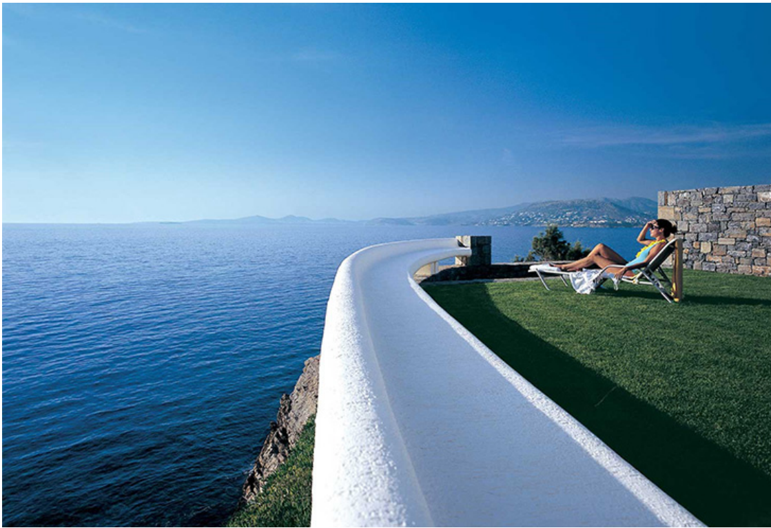
Grand Resort Lagonissi.

Только представьте, что вы оказались на частном полуострове, который, как огромная яхта, рвется в синь Эгейского моря.