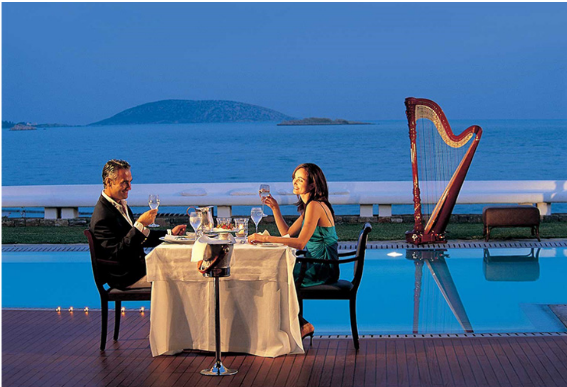
Grand Resort Lagonissi. The Grand Villa

Столь ценимые уважаемыми гостями уединение и приватность здесь уж точно не нарушается ничем — виллы размещаются в уютных местечках, на песчаных пляжах и в частных небольших бухтах, расположенных вдоль всей береговой линии.