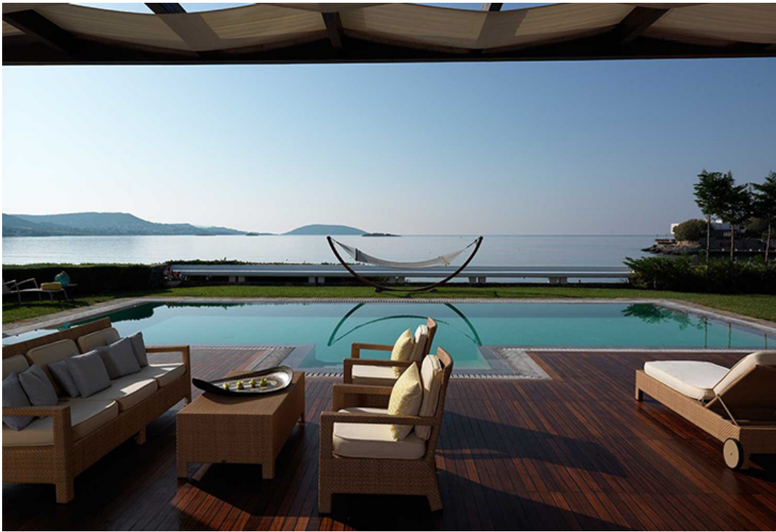
Grand Resort Lagonissi

Чтобы вы ни выбрали - просторный клубный номер, семейное бунгало или виллу, вы окажетесь в окружении эксклюзивных дизайнерских интерьеров с использованием натурального дерева и камня.