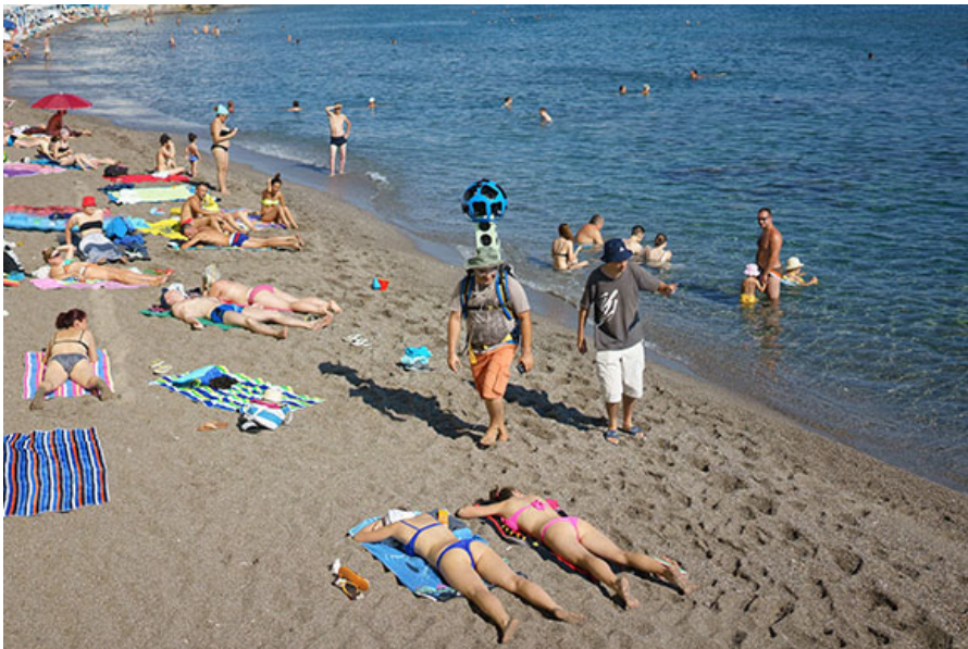
Уже сфотографированы пляжи Херсониссоса от моря до суши с лодки, при поддержке Греческого центра морских исследований.