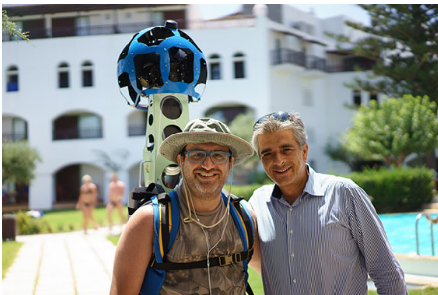
Российский космонавт Антон Шаплеров на Крите

С использованием Trekker, инструмента Google, который обеспечивает инновационные возможности демонстрации изображений 360 градусов и удаленных точек области, гости Херсониссоса скоро будут иметь возможность «исследовать» со своего компьютера недоступные красоты региона.