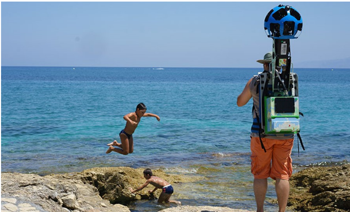
Nemo enim ipsam voluptatem

С использованием Trekker, инструмента Google, который обеспечивает инновационные возможности демонстрации изображений 360 градусов и удаленных точек области, гости Херсониссоса скоро будут иметь возможность «исследовать» со своего компьютера недоступные красоты региона.