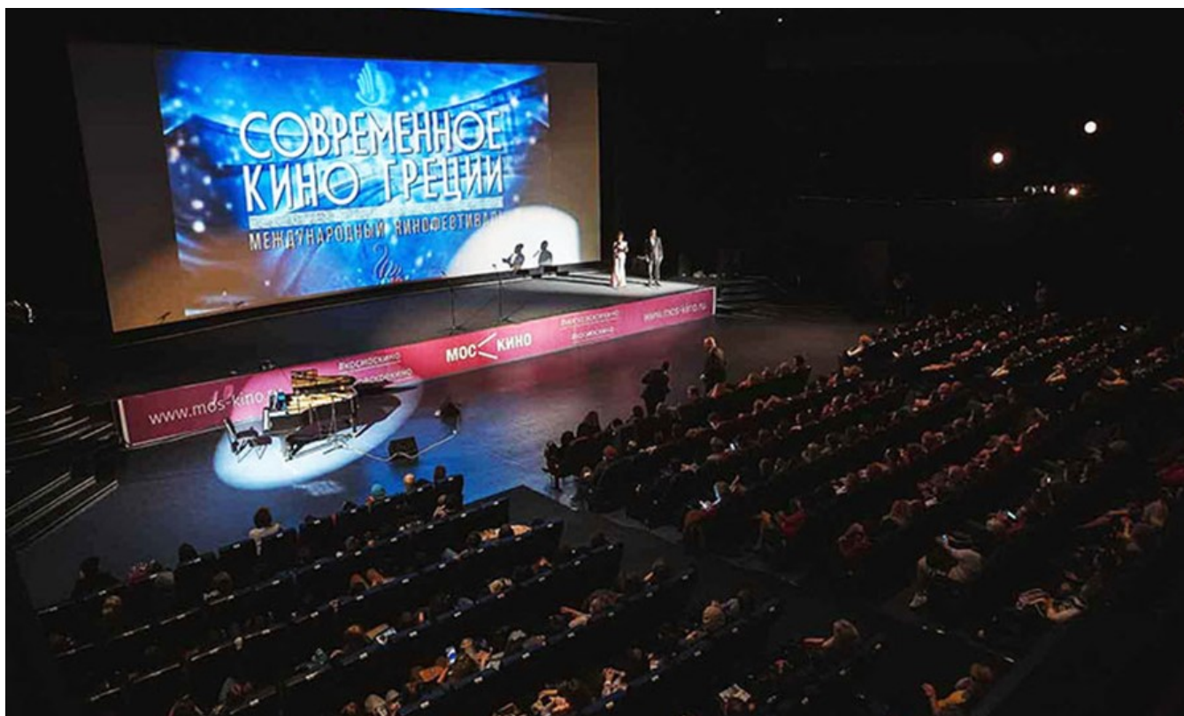
Nemo enim ipsam voluptatem