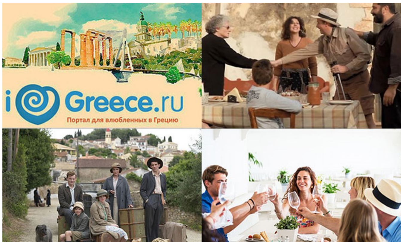
фото : Manwlis \ Nemo enim ipsam voluptatem

Дайджест публикаций за неделю. 28 января / 3 февраля 2019