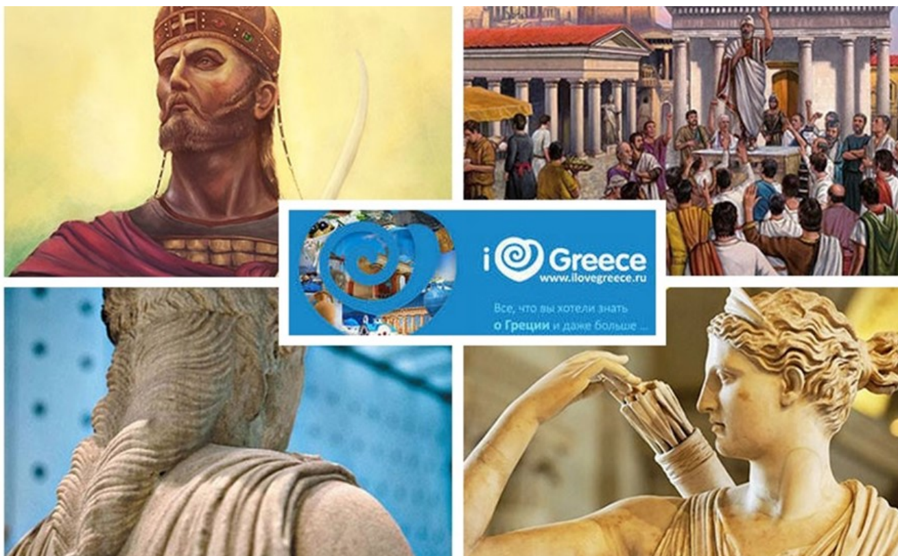
фото : Manwlis \ Nemo enim ipsam voluptatem

Премьер-министр Греции направил послание лидерам ЕС для поддержки экономик, пострадавших от Covid-19, ACROTEL HOTELS отрегулировала все свои отели в соответствии с новыми стандартами здоровья для безопасности своих гостей и сотрудников, обновленный Porto Sani 5* дебютирует на открытом вебинаре Beleon Group, об этом и не только читайте в нашем дайджесте публикаций за прошедшую неделю.