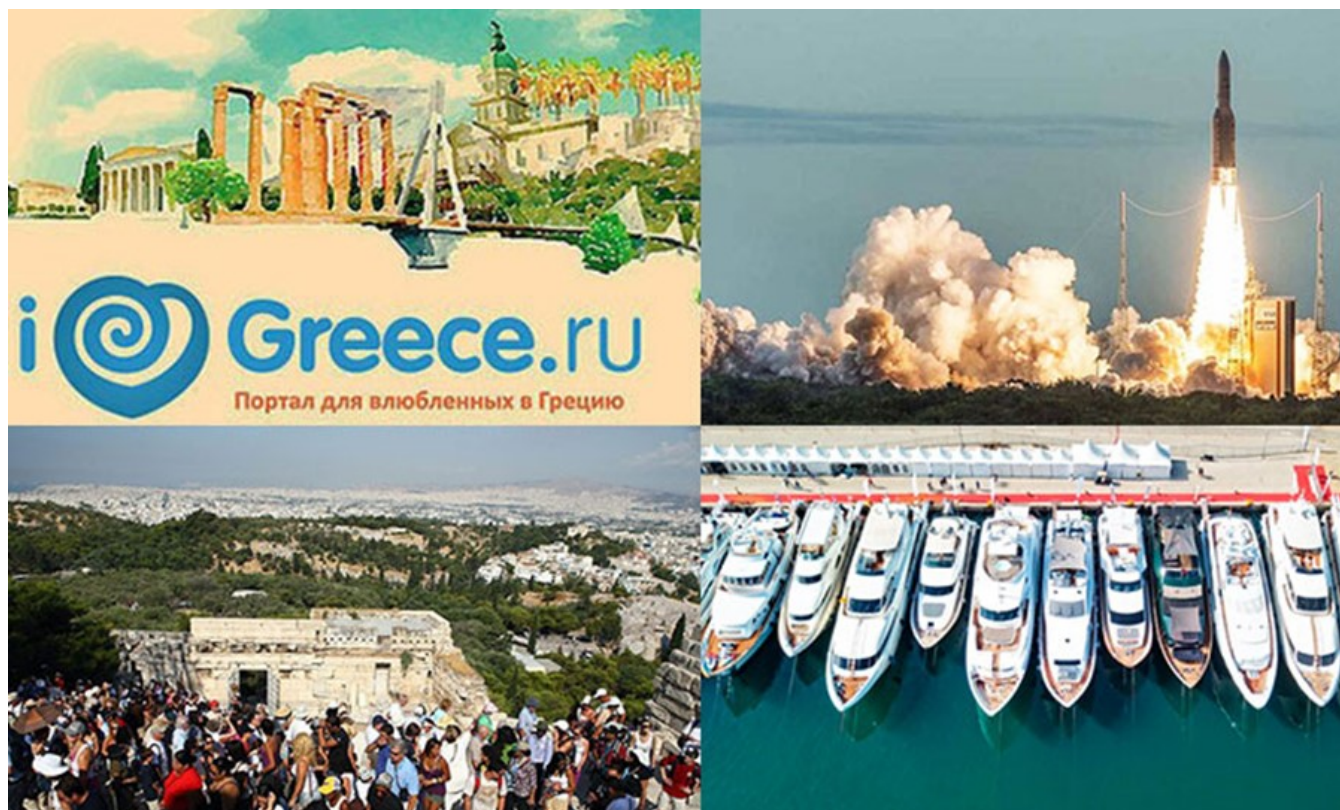
Nemo enim ipsam voluptatem

Дайджест публикаций за неделю. 04 февраля / 10 февраля 2019