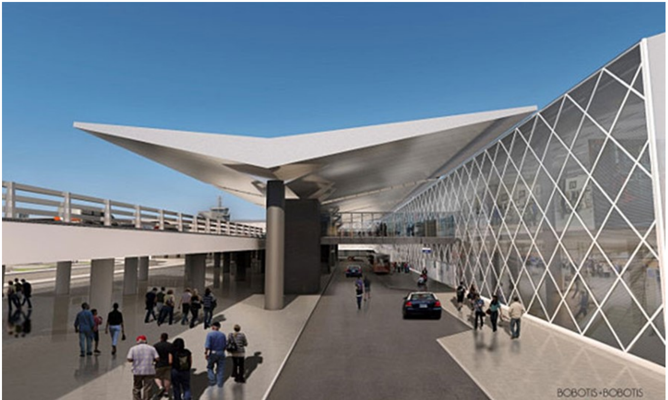
фото : Manwlis \ Nemo enim ipsam voluptatem

Красивее, вместительнее, привлекательнее! Именно такой вскоре должна стать центральная воздушная гавань второго самого большого города Греции – аэропорт «Македония».