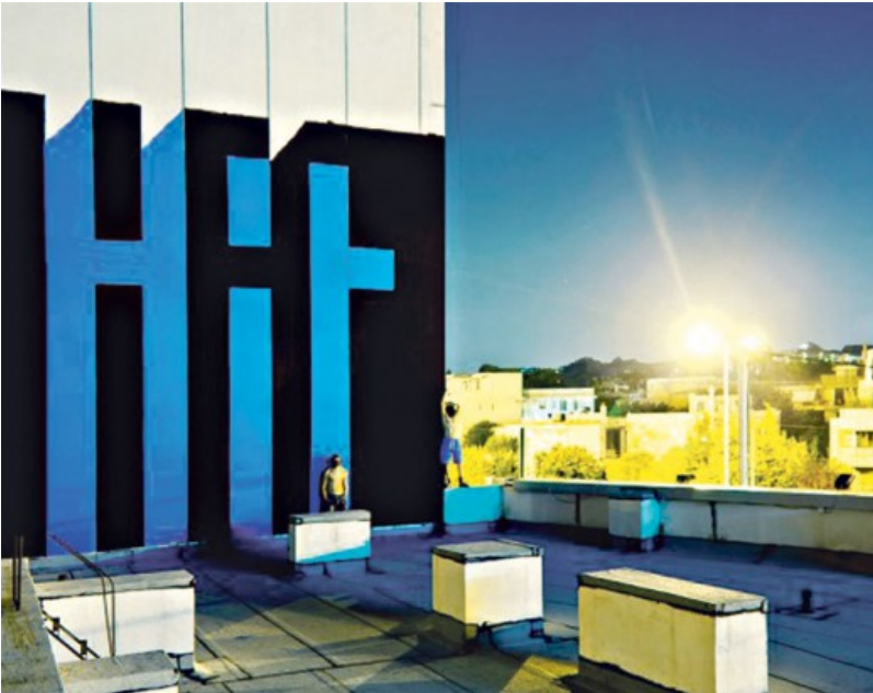
HIT Один из лучших образцов bombing graffiti crews, выдержавших испытание временем. Этим работам пошёл второй десяток лет.