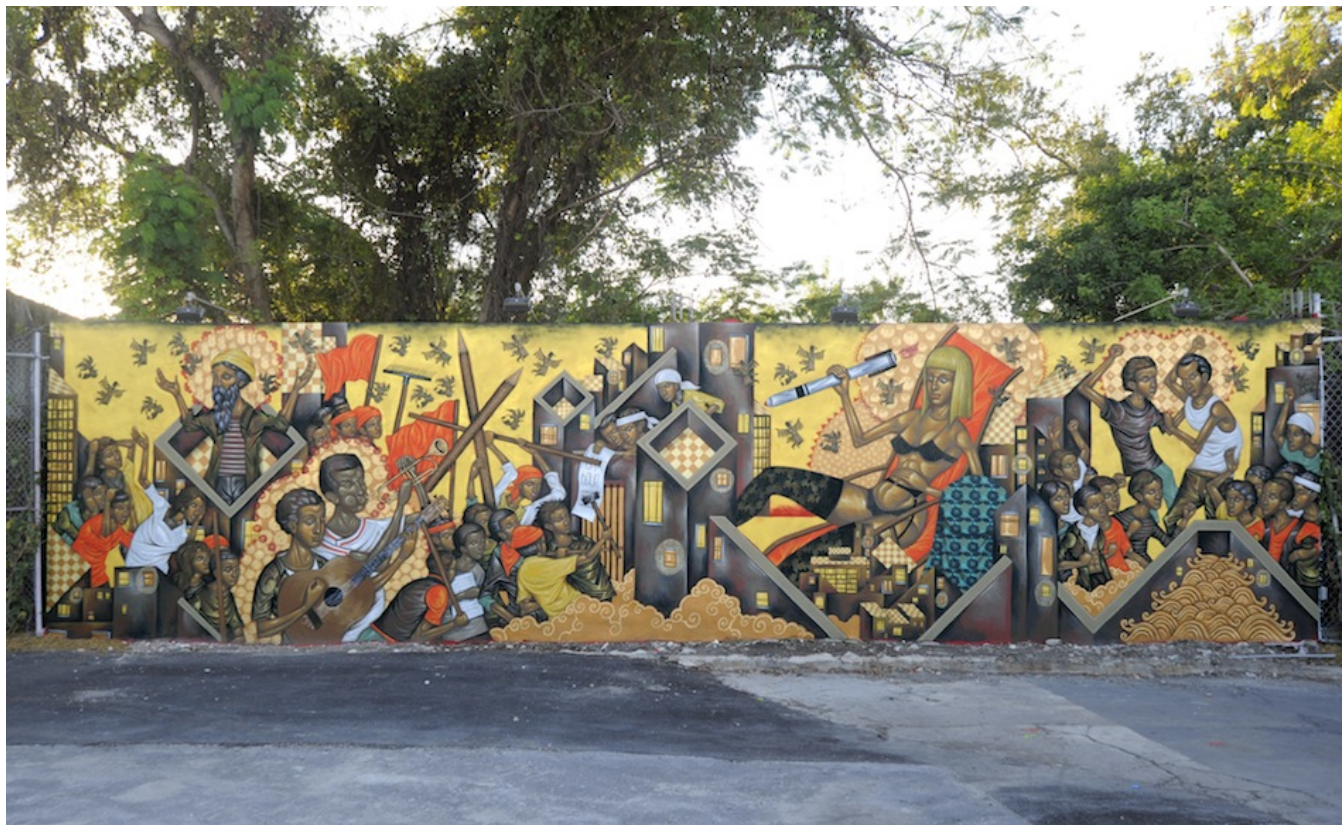
Стелиос фйтакис, Осада (Аллегория Флорида), 2009, роспись стены, 3x12m, Майами

Одна из главных фигур в уличном искусстве (подписывал свои работы bizarre) с середины 90-ых. В его работах видно глубокое влияние византийской иконописи, часто они имеют аллегорический, политический и общественный смысл. Стелиос выставлял их в Нью-Йорке на выставке MoMA.