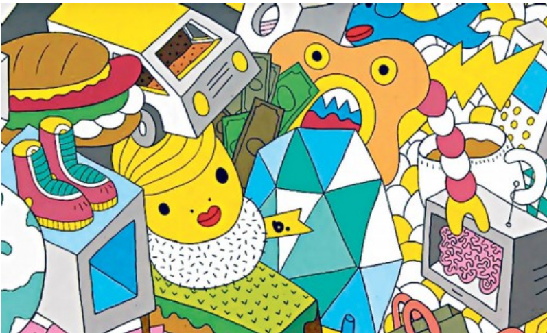
В. занимается граффити с 13 лет и разрисовал стены во многих странах, от Осаки до Бразилии. Народные элементы сочетаются с