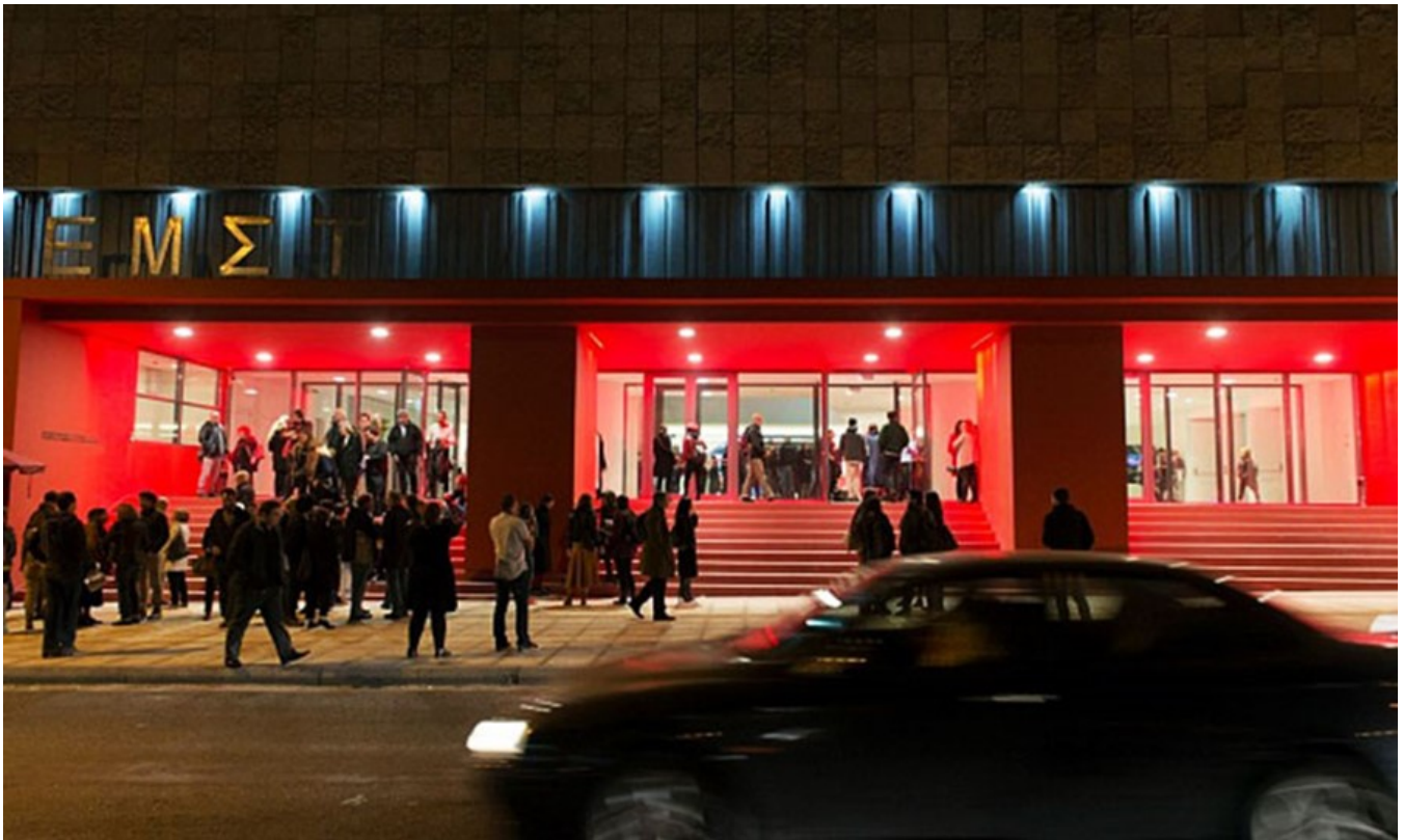
фото : Manwlis \ Nemo enim ipsam voluptatem

Guardian включила Национальный Музей Современного Искусства города Афины в ТОП 10 самых интересных музеев мира, которые откроются в 2017 году.