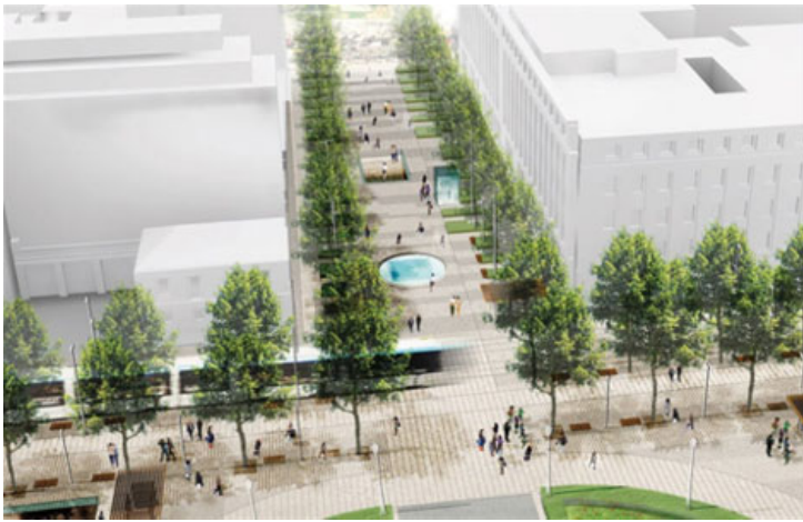
RETHINK ATHENS EXHIBITION VIDEO _gr.

🌐  📍 Греции, Свадьба, Туризм