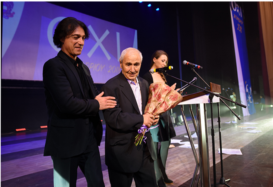
Историческим моментом вечера стало видео-обращение к россиянам национального героя Греции Манолиса Глезоса.