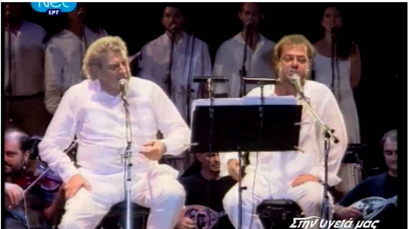
Микис Теодоракис и Яннис Париос.

Нет, не просил. Однажды, когда он /Хадзидакис/ готовил представление в концертном зале «Zoom» и пригласил меня участвовать в его концертах, я работал на тот момент в КЗ «Диогенис». А мне так хотелось петь с ним. Это счастье петь в тени великого человека! Я попросил прощения у Никоса Гатсоса, объяснив, что вопреки желанию не могу участвовать в шоу.