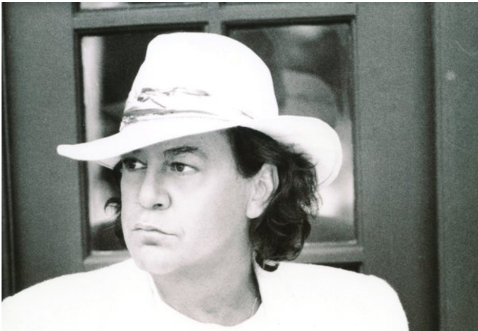
Яннис Париос.

Мне кажется, в вас до сих пор жив бедный паренек из острова Парос.