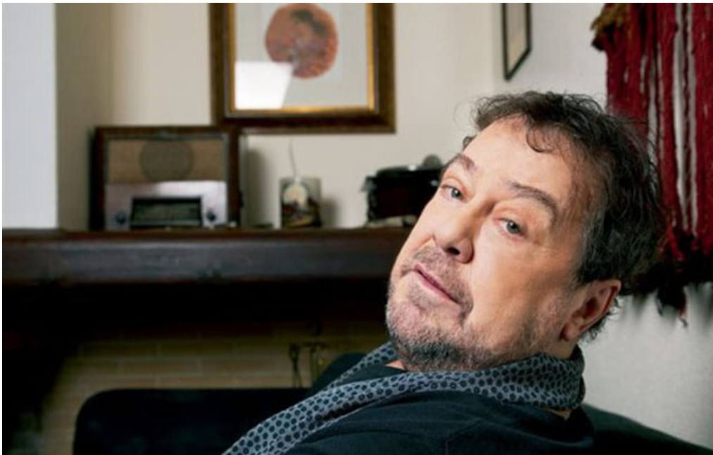
Яннис Париос.

Однако вы выглядите достаточно открытым человеком.