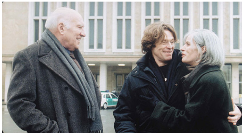
Тео Ангелопулос. Кадр из фильма Пыль времени. 2008.

Картина Ангелопулоса «Пыль времени» она сделана абсолютно в духе работ мастера. Рассматривается с позиций старого человека. Развивается его история, которая является второй частью его кинотрилогии. Построена чрезвычайно сложно, как у него всегда с переходами во времени, с очень большими актерами мирового класса, которые играют главные роли. Картина недавно демонстрировалась на кинофестивале в Берлине. Она, вне всяких сомнений, будет иметь своего зрителя. Хотя, надо признать, что для обычного зрителя кинотеатра в истории довольно трудно ориентироваться. ...Художник продолжает свои поиски в том направлении, в котором он себе начертал, а Ангелопулос один из самых крупных режиссеров интеллектуального философского кино еще остающихся среди нас.