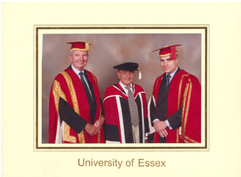
Тео Ангелопулос. Почетный член Essex.