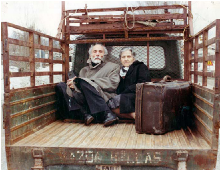
Тео Ангелопулос. Путешествие на Кифиру.

Сейчас или никогда! В ходе пресс-конференции, прекрасно понимая, что у великого режиссера каждая минута сегодня уже распланирована, приближаюсь к президиуму и во время секундной паузы адресуя ему свою просьбу: «Я – российский журналист, ваш соотечественник. Мне очень важно взять у вас интервью, которое с огромным интересом прочтут греки России и постсоветского пространства. ...Могу сказать, что один из самых моих любимых фильмов является ваше "Путешествие на Кифиру. ...У меня накопилось к вам много вопросов".