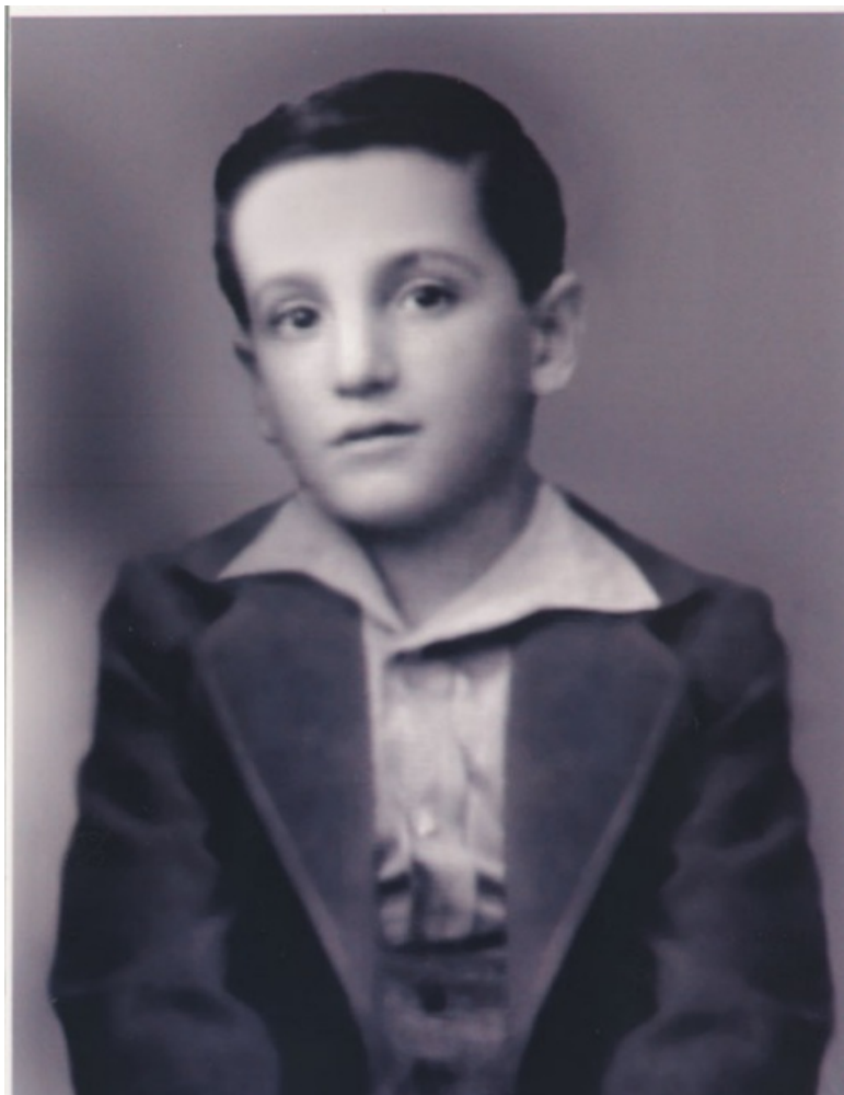
Тео Ангелопулос. 1945 год.

В свою очередь, я, 9-летний мальчишка, с матерью, держа ее за руку, отправились в Перистерии. В поисках тела отца. В Перистерии тогда проходили расстрелы людей.