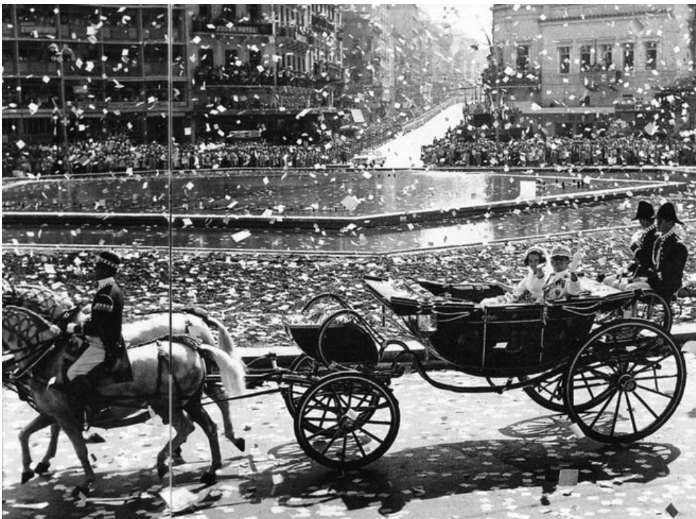
Свадьба Константина II и датской принцессы Анна-Марии.

На пути к собору свадебная процессия торжественно прокатилась по городу, где королевскую чету приветствовали тысячи людей, а с балконов и террас летел свадебный белый конфетти.