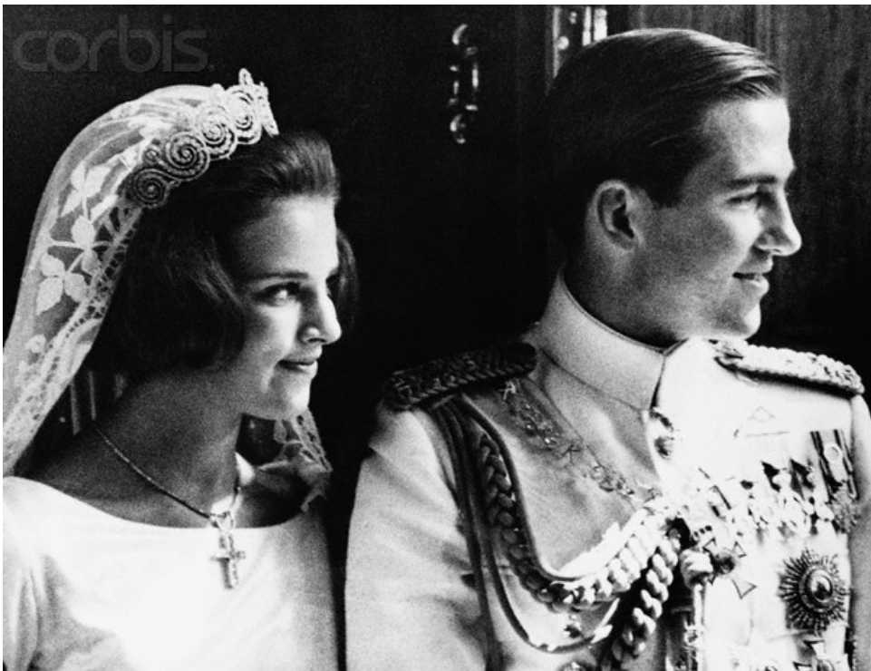
Свадьба Константина II и датской принцессы Анна-Марии.

Как сообщали многие датские и греческие издания, после королевского бракосочетания датчан охватил настоящий греческий «бум»: многие отправились знакомиться с достопримечательностями южной страны и были поражены великим наследием Древней Эллады, богатейшей культурой, добротой, открытостью и гостеприимством народа. Отмечали также, что в последующий за женитьбой короля год состоялись пятьдесят интернациональных греко-датских бракосочетаний. Двадцать свадеб прошли на острове Родос, остальные – в Афинах и других достопримечательных местах Греции в декорациях рукотворной и природной красоты с соблюдением национальных греческих обычаев.