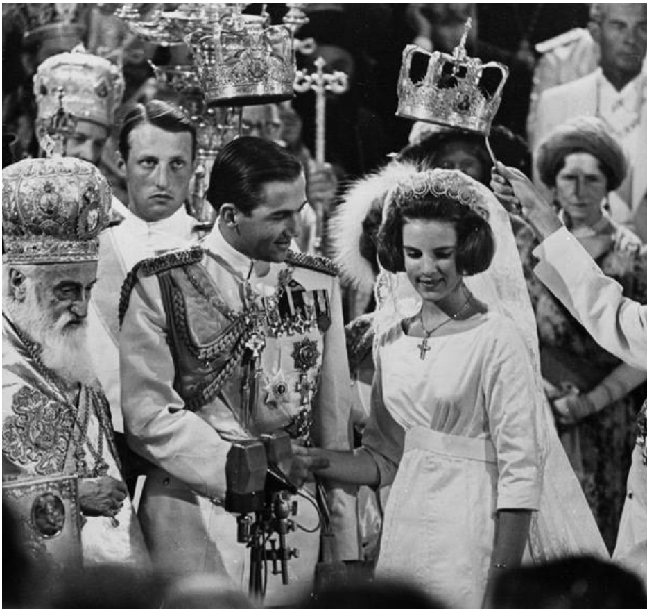
Свадьба Константина II и датской принцессы Анна-Марии.

На пути к собору свадебная процессия торжественно прокатилась по городу, где королевскую чету приветствовали тысячи людей, а с балконов и террас летел свадебный белый конфетти.