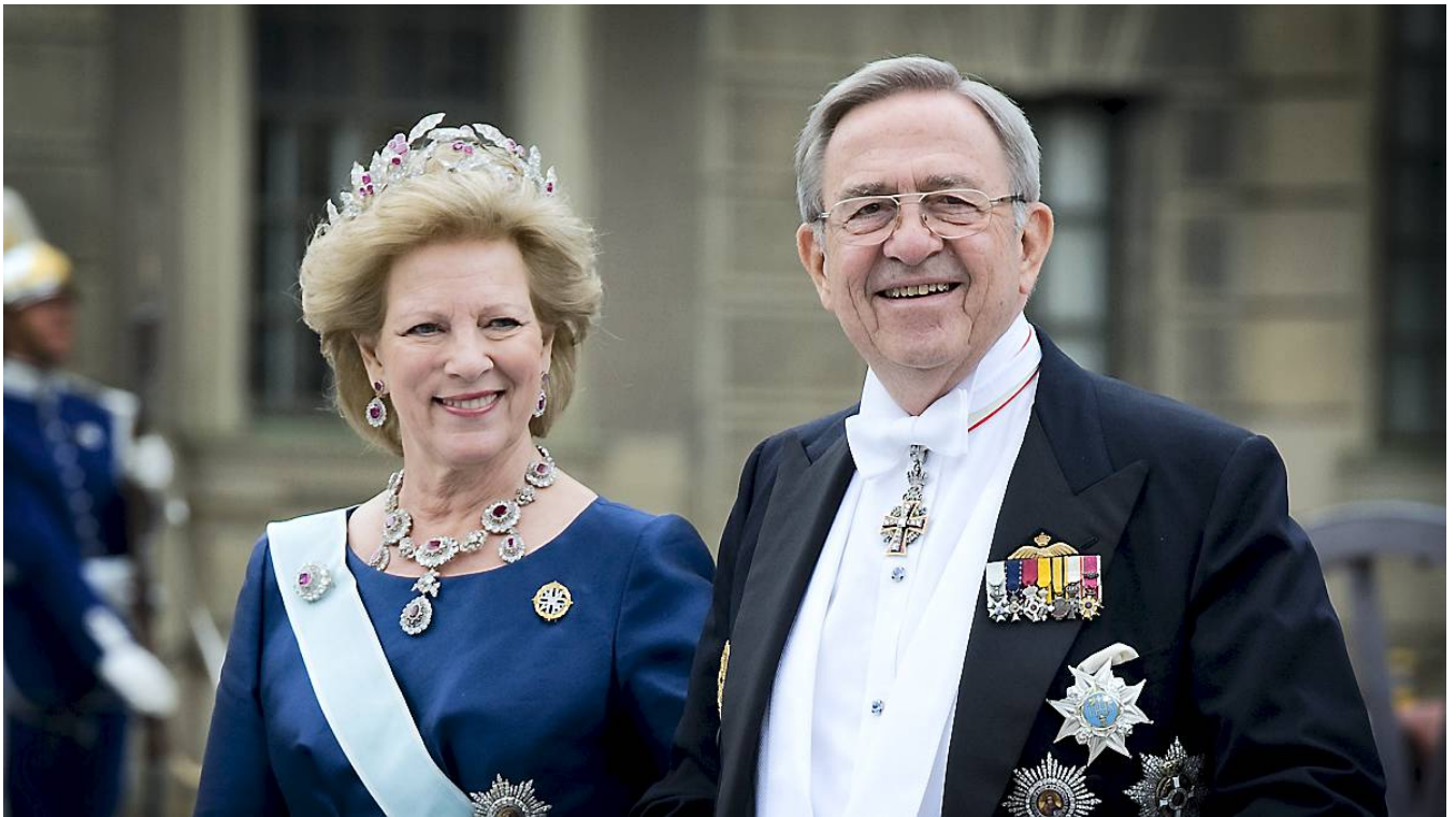
Свадьба Константина II и датской принцессы Анна-Марии.

Семейная жизнь Константина и Анны-Марии оказалась очень счастливой, у пары пятеро детей. Этот брак часто называют примером супружеского счастья и взаимопонимания. В 2014 году бывшая королевская чета Греции отметила «золотую свадьбу».