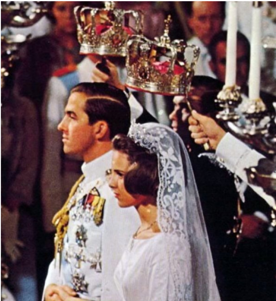
Свадьба Константина II и датской принцессы Анна-Марии.