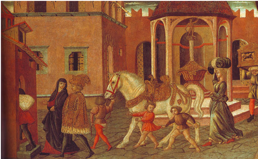
Подготовка приданого. Итальянская фреска XV века.

На Руси также существовал выкуп, но понимали под ним не какое-то серьезное вложение средств, а скорее спектакль на потеху собравшимся. Жених и его товарищи, направляясь в день свадьбы к дому невесты, звонкой монетой, сладостями, решением загадок и головоломок отпугивали всячески преграждавших им путь родственников и соседей избранницы. Выкуп на Руси был всего лишь красивой традицией, частью свадебного действия, и вовсе не отменял приданого.