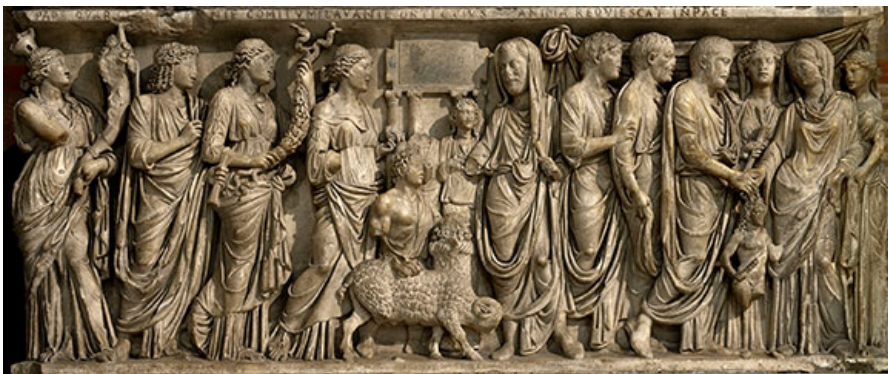
Барельеф с изображением древнеримской свадьбы.

В назначенный день в присутствии родственников, гостей и священнослужителей совершался настоящий спектакль, где каждое действие, каждый шаг выполнялись в соответствии с традицией и имели определенный смысл.