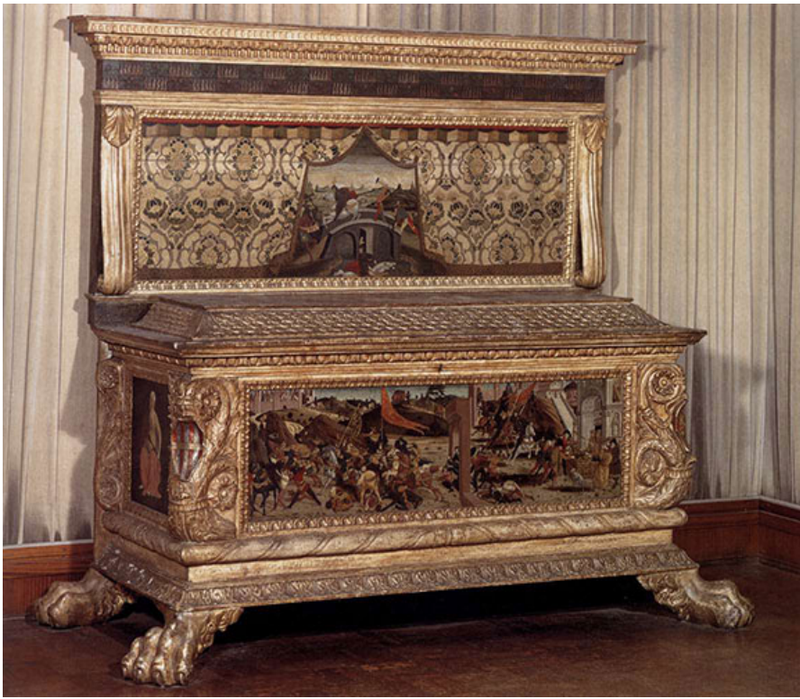
Итальянский свадебный сундук-кассоне для приданого. XV век.