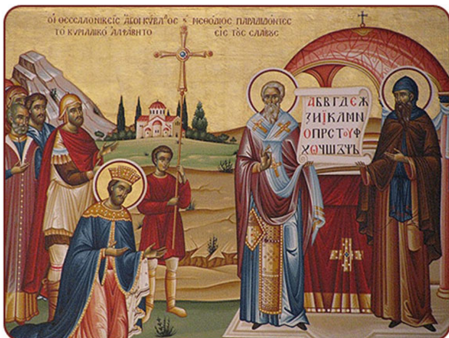
Святые равноапостольные Кирилл и Мефодий, просветители славян.

История Салоник, начиная с X века – череда нападений иноземцев, которые сменялись короткими периодами покоя и благополучия, когда в городе развивались искусство, литература, богословие, строились новые храмы и монастыри.