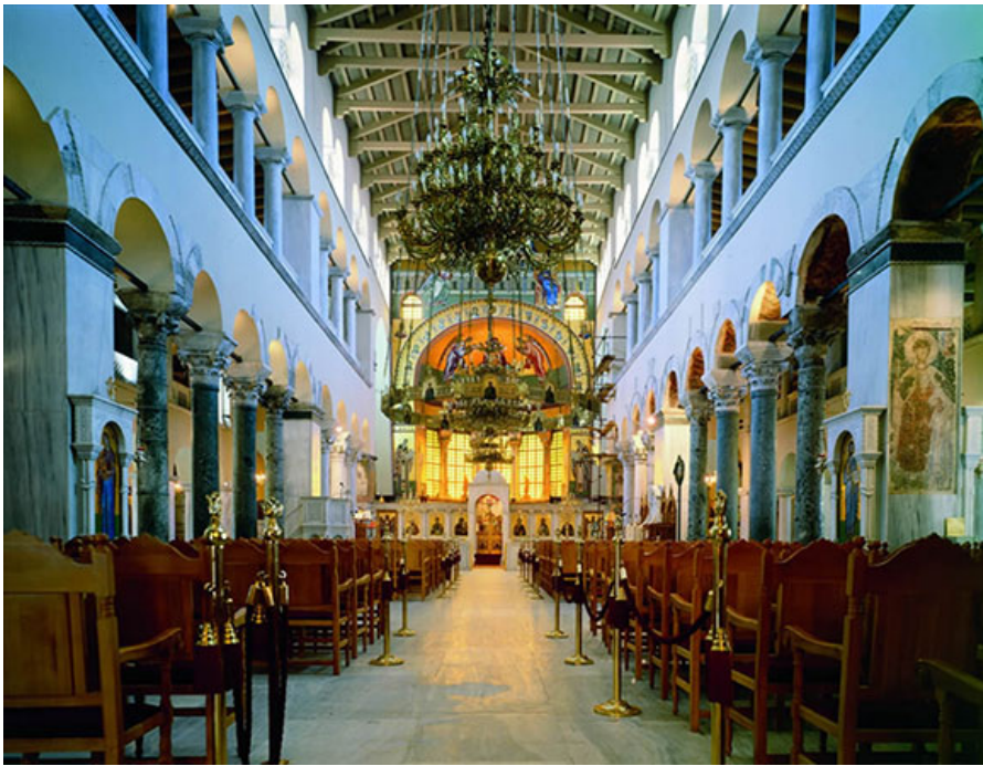
Центральный неф базилики Святого Димитрия.

При реставрации базилики Святого Димитрия, которая началась в 1926 году, постарались максимально использовать сохранившиеся оригинальные колонны, мозаики и облицовку.