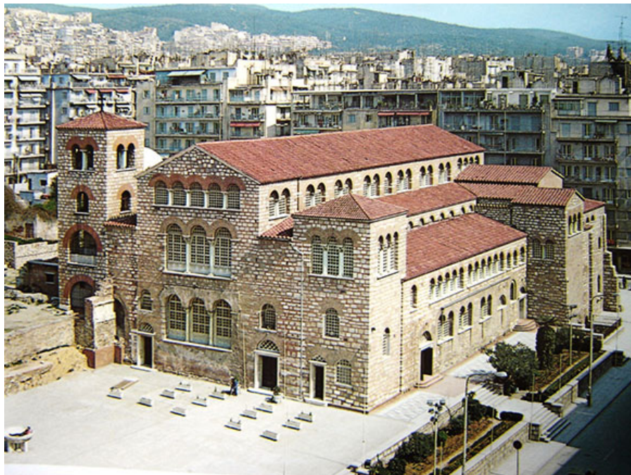
Базилика Святого Димитрия Солунского.

Величественная пятинефная базилика, посвященная святому покровителю Салоник, построена на месте погребения святого Димитрия, здесь в нише дни находится рака с мощами святого, а с криптой (подземными помещениями) базилики связана история его мученичества.