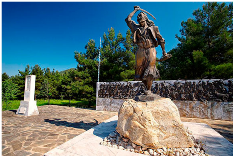
Памятник Стаматису Капсасу на полуострове Халкидики.

Когда же в 1821 году греческий народ поднялся против османского ига, Салоники не остались в стороне. Повстанцы во главе со Стаматисом Капсасом попытались с боем взять город, но безуспешно. Освобождение Салоник от турок состоит лишь в 1912 году в ходе I Балканской войны, очень символично, что случится оно 26 октября - в день памяти небесного покровителя города святого великомученика Димитрия Солунского.