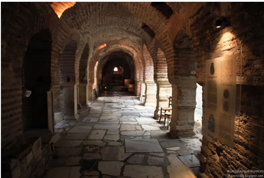
Крипта базилики Святого Димитрия.

В VII веке собор пострадал от пожара, но вскоре был возрожден, и в ходе восстановительных работ приобрел свой современный вид. В IX веке стены базилики были украшены великолепными мозаиками, часть из них, чудом уцелевшую, и сегодня можно видеть на стенах собора, другая часть выставлена в музее, расположенном в его крипте.