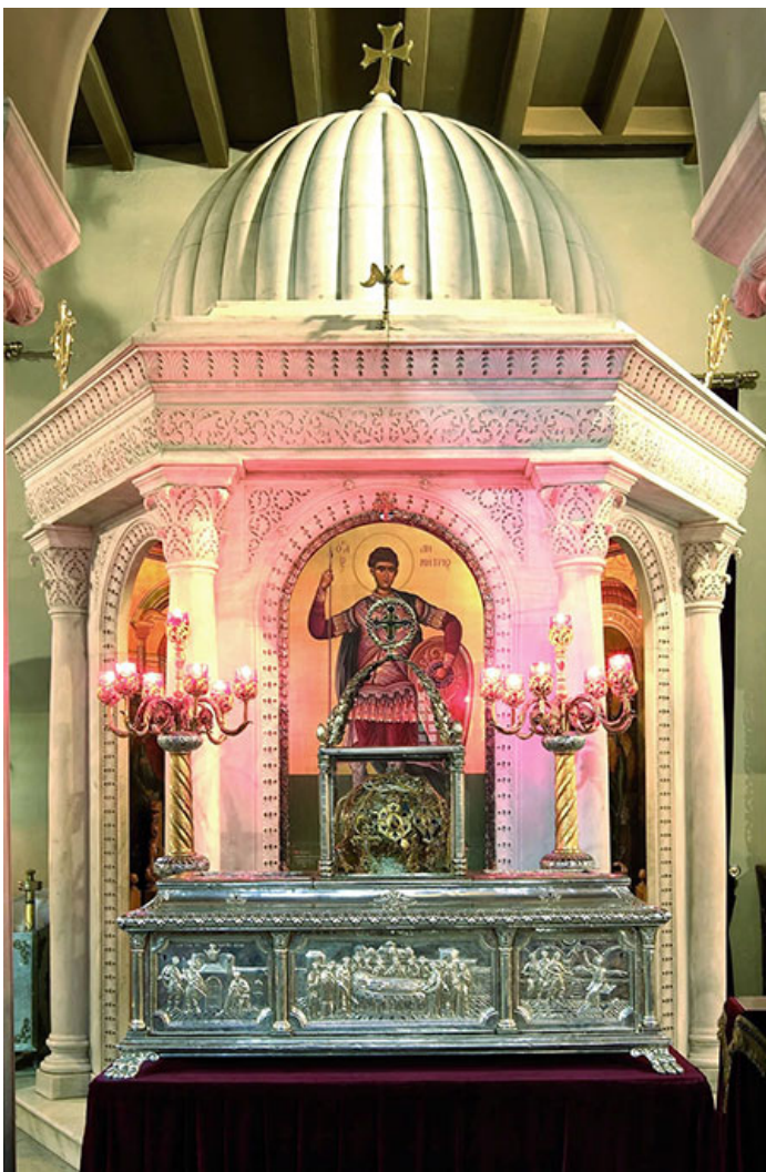
Киворий и рака с мощами святого Димитрия Солунского.

Этим пожаром не закончились беды, постигшие город и главный его храм. Пять столетий спустя собор был осквернен нападшими на Салоники скандинавами, а веком позже захватившие город крестоносцы вывезут мощи святого Димитрия. Долгие годы святыня будет находиться в Италии, пока в середине XX века не вернется на свое исконное место.