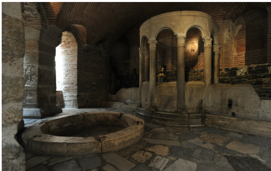
Киворий в крипте базилики Святого Димитрия, рядом с ним - резервуар для святого мира.

Столетием позже знатный иллириец по имени Леонтий, получивший исцеление от паралича, построит на этом месте первый большой храм, алтарная часть которого придется на место захоронения святого. Мощи великомученика Димитрия упокоятся в серебряной раке в мраморном кивории (навес с колоннами), в наши дни его можно увидеть в крипте собора.