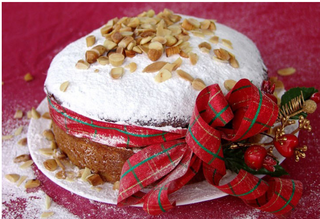
Василопита – «пирог святого Василия» с пожеланием «Многая лета»

Святой Василий не путешествует по небу на санях, запряженных оленями, да и внешне не похож на добродушного румяного Санта Клауса или седобородого Деда Мороза. Святой Василий высокий и худой, его волосы и борода еще не успели поседесть, а костюм он носит похожий на одеяние священника. Нет у святого Василия и мешка с подарками. Подарок от него всегда небольшой, символический, и обязательно сопровождается добрым словом и просьбой святого к человеку делать благие дела и быть верным христианином.