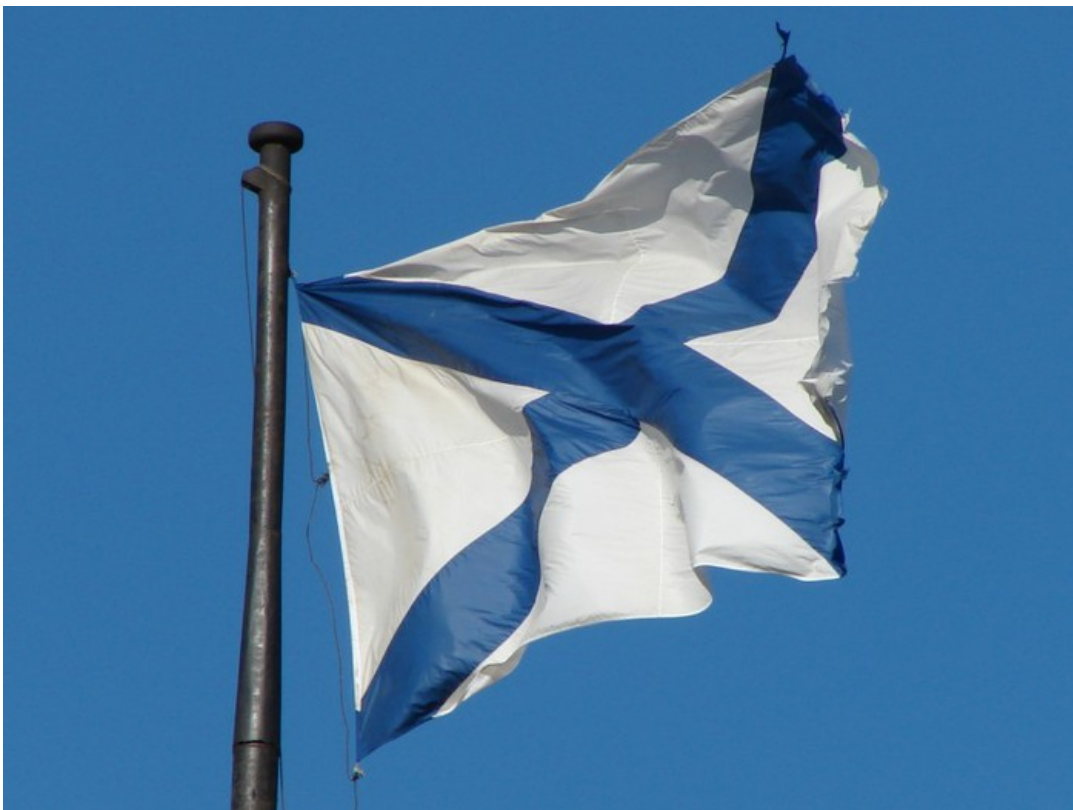
«С нами Бог и Андреевский Флаг!» - девиз моряков Российской империи. Андреевский флаг – флаг ВМФ России.

Во все времена на Руси особо чтили Андрея Первозванного. Так в основание Петропавловской крепости был заложен ковчежец с частицей мощей святого апостола; первым российским орденом, учрежденным Петром, был орден Святого Андрея Первозванного; а Андреевский флаг – основной флаг Российского Флота.