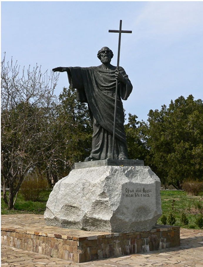
Памятник Андрею Первозванному в Севастополе.

Во все времена на Руси особо чтили Андрея Первозванного. Так в основание Петропавловской крепости был заложен ковчежец с частицей мощей святого апостола; первым российским орденом, учрежденным Петром, был орден Святого Андрея Первозванного; а Андреевский флаг – основной флаг Российского Флота.