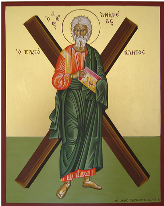
Икона святого апостола Андрея Первозванного.

креста, считая себя недостойным принять смерть своего учителя.