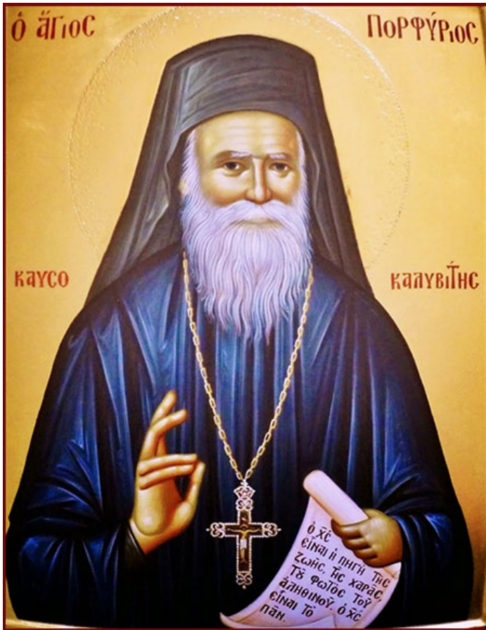
Преподобный старец Порфирий Кавсокаливит.

Монах Никита желал навсегда остаться на Святой горе, но воля Божья была иной. Он тяжело заболел: воспаление легких переросло в плеврит. Духовные наставники приказали Никите оставить Афон и отправиться в больницу. Через некоторое время, пройдя лечение и почувствовав себя лучше, он вновь вернется в свою келью на Святую гору. Однако здоровье его вновь начало ухудшаться, и старцы, опасаясь за его жизнь, отправили юношу обратно, не благословив на возвращение на Афон.