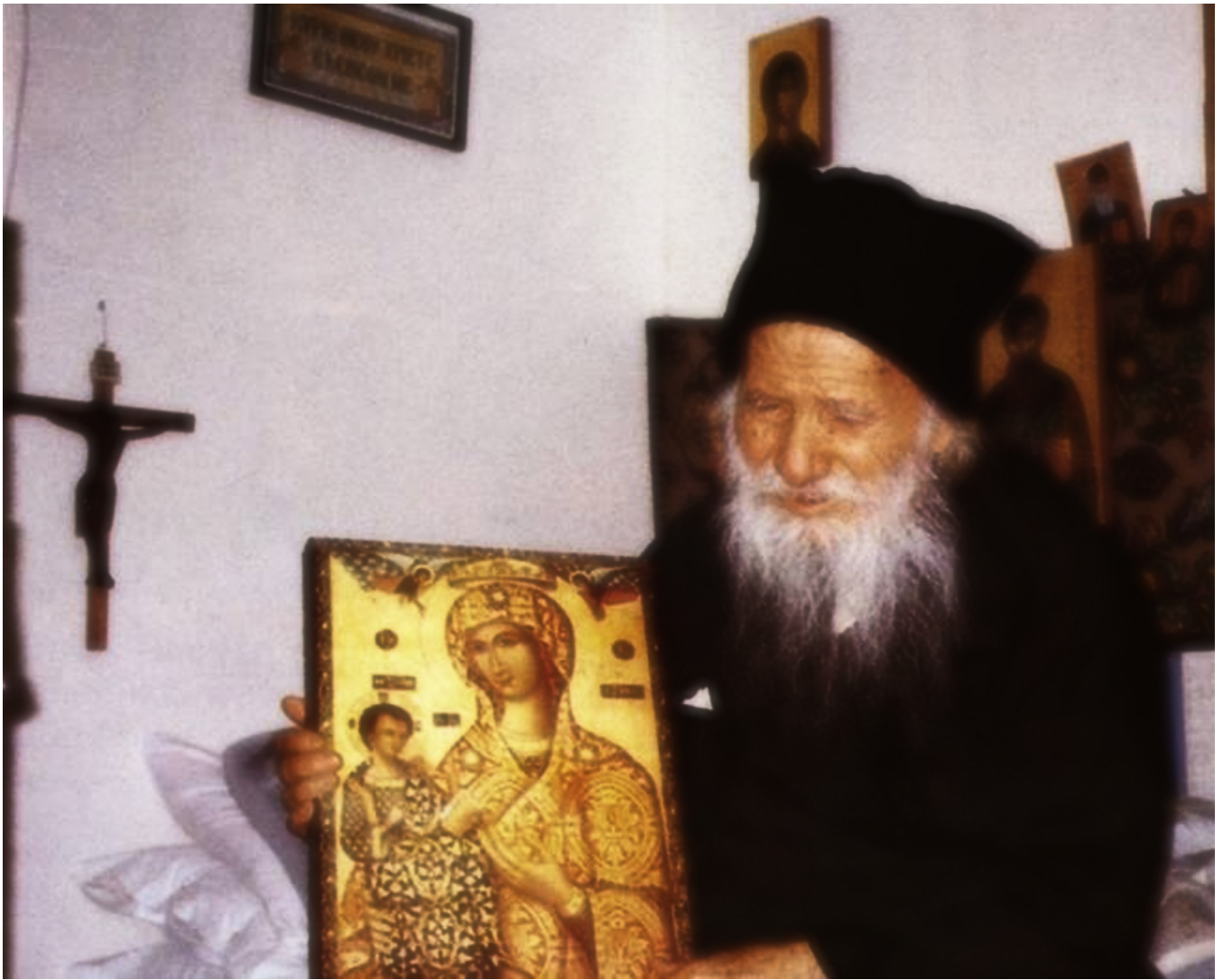
Преподобный старец Порфирий Кавсокаливит

Будучи на пенсии, отец Порфирий служил в древнем храме Святителя Николая в Пендели вплоть до августа 1978 года, когда с ним случился инфаркт. Двадцать дней старец провел в больнице, а затем несколько месяцев оставался в доме своих друзей в Афинах.