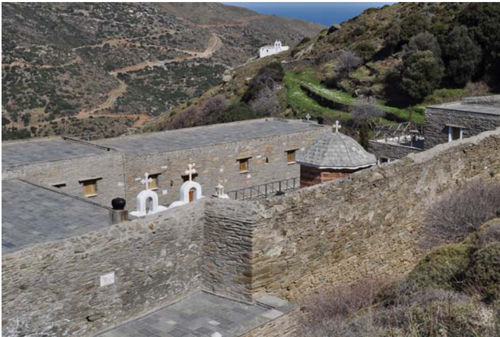
Построен монастырь был в VIII веке, и таким образом расположен, чтобы его не было видно часто нападавшим на остров пиратам.