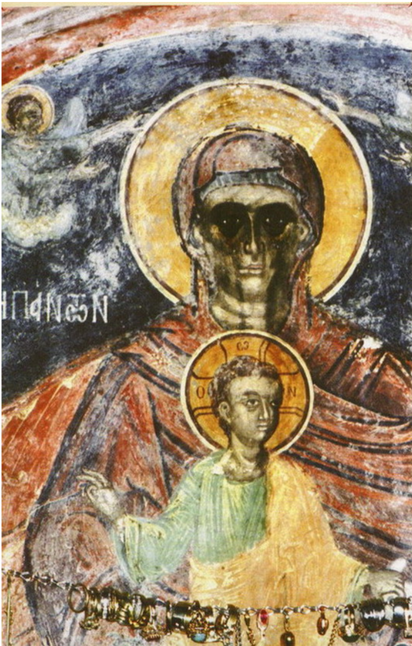
Еще одним чудом монастыря св. Николая Чудотворца является фреска Богородицы «Надежда всех и упование» XV века в притворе храма. Богоматерь, сидящая на троне с Младенцем Христом на коленях, на протяжении долгих лет плачет, когда страшнейшие несчастья сотрясают мир: катастрофы, стихийные бедствия, войны.