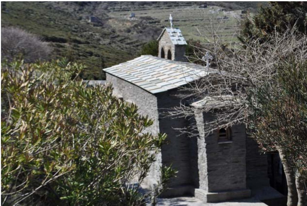
Под алтарной частью храма Николая Чудотворца протекает святой источник, известный со времен основания святой обители.