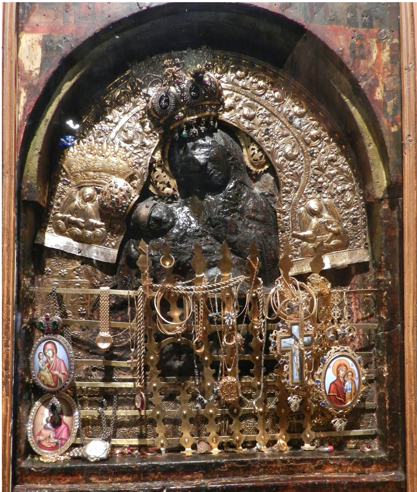
Икона Богоматери Великопещерная

Выросла обитель на том самом месте, где была явлена миру икона Богоматери Великопещерная. По преданию создал этот чудотворный образ святой апостол и евангелист Лука, но не кистью и краской, как другие иконы: этот образ апостол вырезал из воска и мастики.