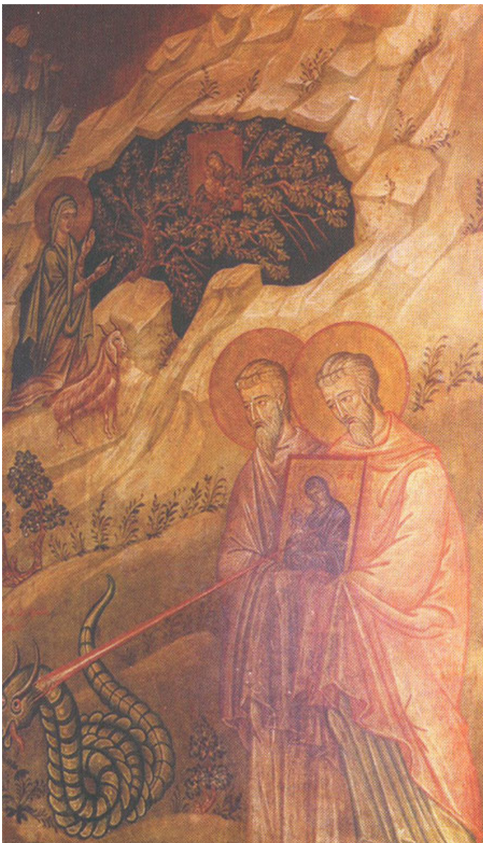
Образ змеи в пещере Мега спилео.

Найдя икону в пещере, братья вынесли ее, чтобы пещеру очистить. Они подожгли скопившийся там мусор, а сами вместе с Ефросиньей ждали снаружи, как вдруг из пещеры, разбуженная пламенем и дымом, вылетела огромная змея. Испугавшись, все отинули от пещеры, как неожиданно из иконы вырвалась молния и пронзила змею.