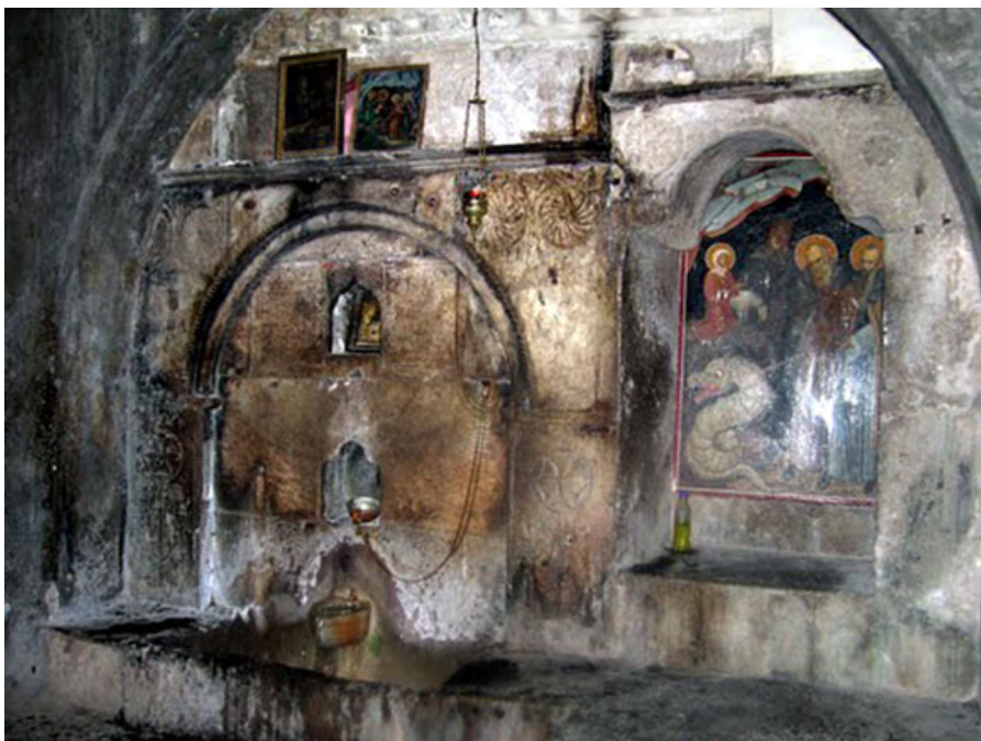
Источник Ефросиньи.

Монахи Симеон и Феодор всю жизнь прожили в Мега Спилео и скончались там же. Ефросинья поселилась в небольшой келье неподалеку от монастыря, где и прожила до конца дней своих. В честь нее назвали святой источник, бьющий в монастыре.