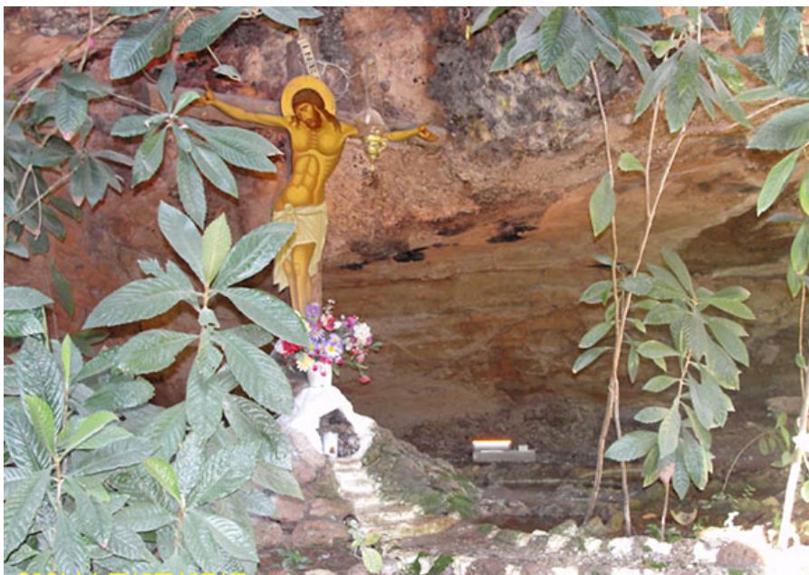
Место в пещере, где была найдена икона

Симеон и Феодор расширили пещеру и построили с ней рядом несколько келий. Весть об иконе, творящей чудеса, разлетелась по всему Пелопоннесу, христиане стали приходить поклониться ей. Многие решили остаться с братьями Симеоном и Феодором, так монастырь разрастался. И сегодня представляет он собой восьмизэтажное здание, охватывающее вход в пещеру.