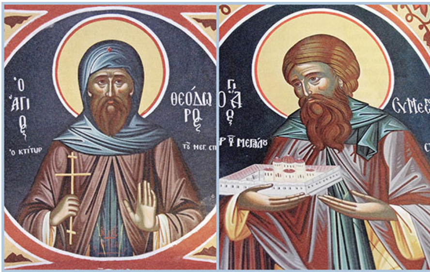
На фото свв. Симеон и Феодор, фреска монастыря Мега Спилео