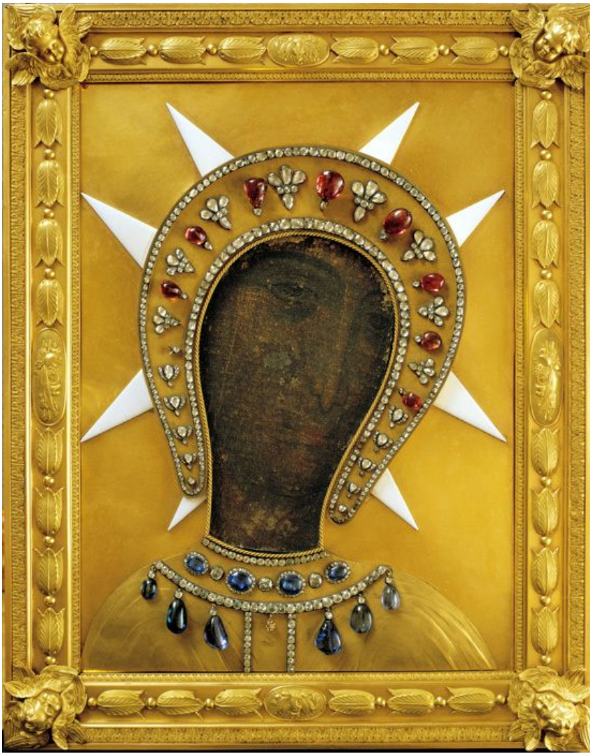
Копия Филеримской иконы.

Долгие годы рыцари будут хранить эту святыню, они увезут ее с собой на Кипр, а затем на остров Родос, который станет резиденцией ордена на два столетия.