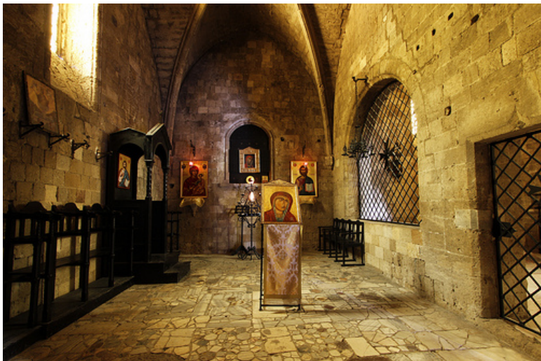
Копия Филеримской иконы.

Сегодня знаменитая Филеримская икона находится в Черногории, в музее города Цетинье. Раздаются голоса за то, чтобы вернуть икону верующим, разместить в одном из храмов ее предыдущего пребывания, но пока эти просьбы услышаны не были, икона так и остается музейным экспонатом.