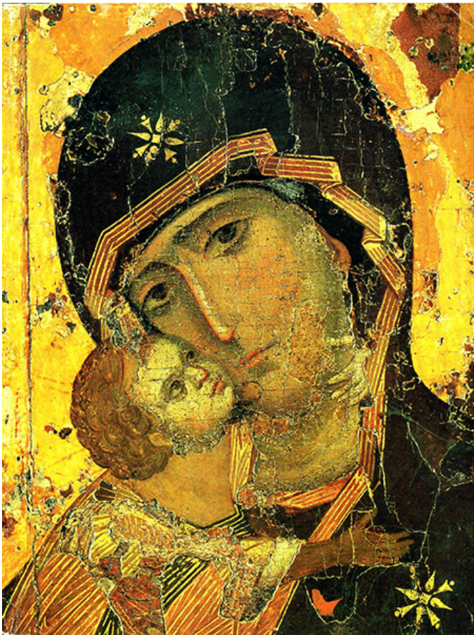
Владимирская икона Богородицы, фрагмент

На Русь из Константинополя будет привезена величайшая святыня – одна из первых икон Богородицы, написанных апостолом и евангелистом Лукой, - известная сегодня как Владимирская. А над убранством храмов Москвы и Новгорода трудился великий иконописец Феофан Грек, внесший огромный вклад в развитие русской иконописной традиции.