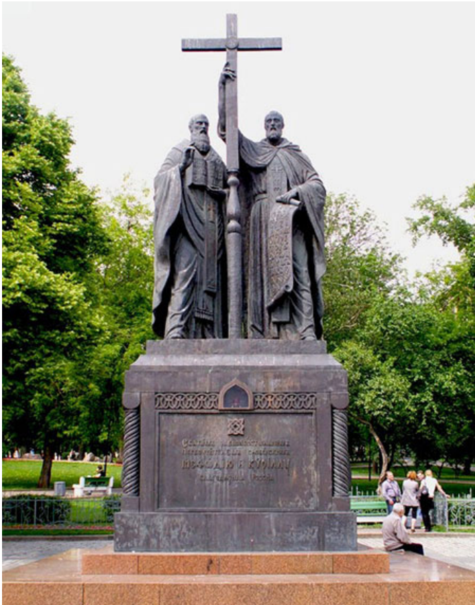
Памятник святым равноапостольным Кириллу и Мефодию, Славянская площадь, г. Москва

Самым главным приобретением русских от Византии стало Крещение – принятие Русью православной веры, основы византийской культуры. Приняв христианство от Константинополя, русские восприняли от греков не только церковные каноны и предписания, но и развили собственную богатейшую православную культуру и духовность.