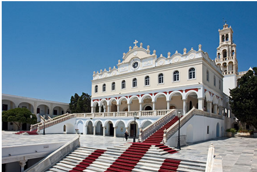
Храм Богородицы Мегалохарис.

Тиносцы взялись за реконструкцию храма, явившегося из-под земли. Более полувека велись работы. И сегодня, глядя на Храм Евангелистрии, сложно поверить, что на таком маленьком островке, как Тинос смогли возвести столь величественное строение, удивляющее роскошью интерьера, выстланными мрамором дворами и внутренними деталями убранства, украшенными искуснейшей мраморной резьбой.