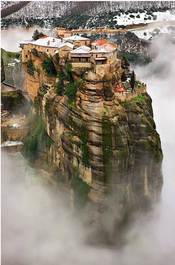
Монастырь Преображения Господня или Великий Метеор.

Метеора (Μετέωρα) – «Пляшущая в воздухе»: так назвал скалу Платилифос преподобный Афанасий, а следом это имя распространилось и на другие скалы, окружающие эту. Саму же Платилифос определили как «Великий» или «Большой Метеор», так же называют и Преображенский монастырь.