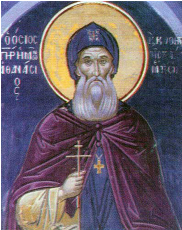
Св. Афанасий Метеорский. Фото с сайта - christianvivliografia.files.wordpress.com

Афанасий (в миру Андроник) подвизался на Святой горе, но повторявшиеся вновь и вновь набеги осман заставили его покинуть Афон. Вместе со своим наставником старцем Григорием Афанасий придет на Метеоры.