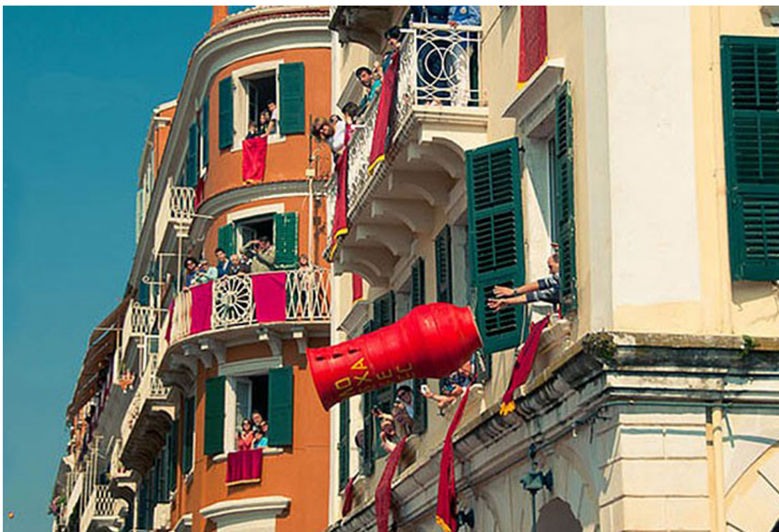
Чистый четверг на Керкире.

В Великий или Чистый четверг наступает кульминация Евангельской истории. В этот день вспоминают Тайную вечерю, когда Иисус Христос собрал учеников и дал каждому из них хлеба, как символ своей плоти, и вина – символ крови, установив тем самым главное христианское таинство – таинство причастия. В этот же вечер Иисус во время молитвы в Гефсиманском саду был предан Иудой и арестован.