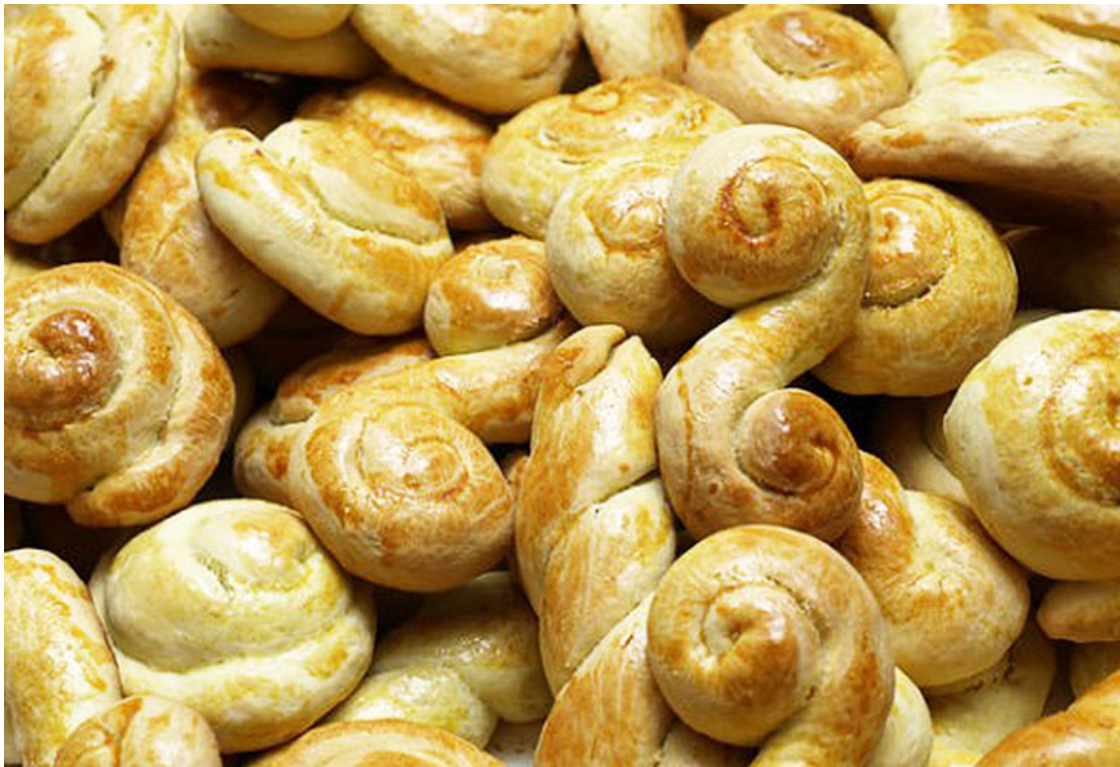
Пасхалино кулураки. Фотос сайта - www.athinorama.gr

В Великий вторник гречанки начинают готовить пасхальную выпечку. Поговорка «Хлеб – всему голова» удивительно подходит стилю жизни греков. Сложно представить греческий стол без свежего хлеба с хрустящей корочкой. Что же касается праздников – это прекрасный повод порадовать семью румяной выпечкой. Почти для каждого церковного праздника есть свой собственный рецепт: для Рождества – христосомо, в Чистый понедельник – лагана, в день Святого Фанурия – фануропита и др.