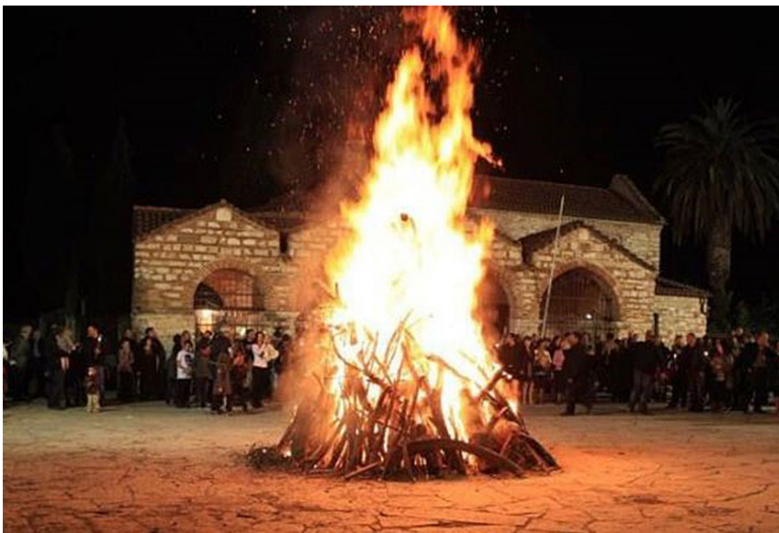
Символическое сожжение Иуды на о. Крит

Праздник начинается вечером Великой Субботы, когда совершается торжественная Пасхальная служба. Люди отправляются в церковь, неся с собой пасхальные свечи и лампы, затем в полной темноте зажигают их от Благодатного огня, горящего в храме. После этого с пением и зажженными свечами люди вновь совершают крестный ход. Греческий крестный ход отличается от процессии Русской церкви: идут не вокруг храма, а по улицам города на центральную площадь.