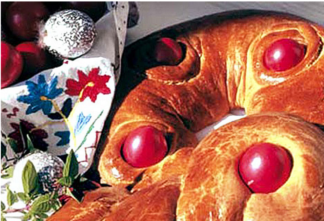
Пасхальный хлеб ламбропсомо.

В Греции верят также, что первое окрашенное яйцо имеет чудодейственную силу, поэтому его оставляют в домашнем иконостасе.