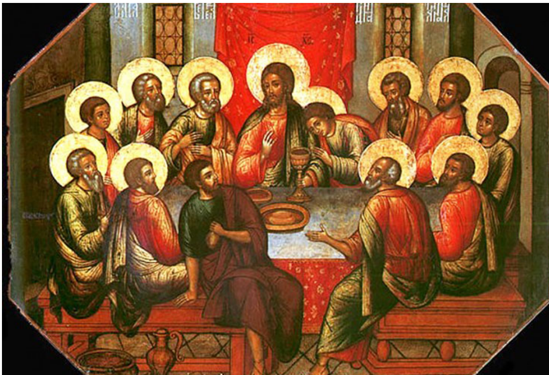
Симон Ушаков. Тайная вечеря.

Гречанки в этот день по традиции приносят на благословение священнику еще неокрашенные яйца и закваску для пасхального хлеба.