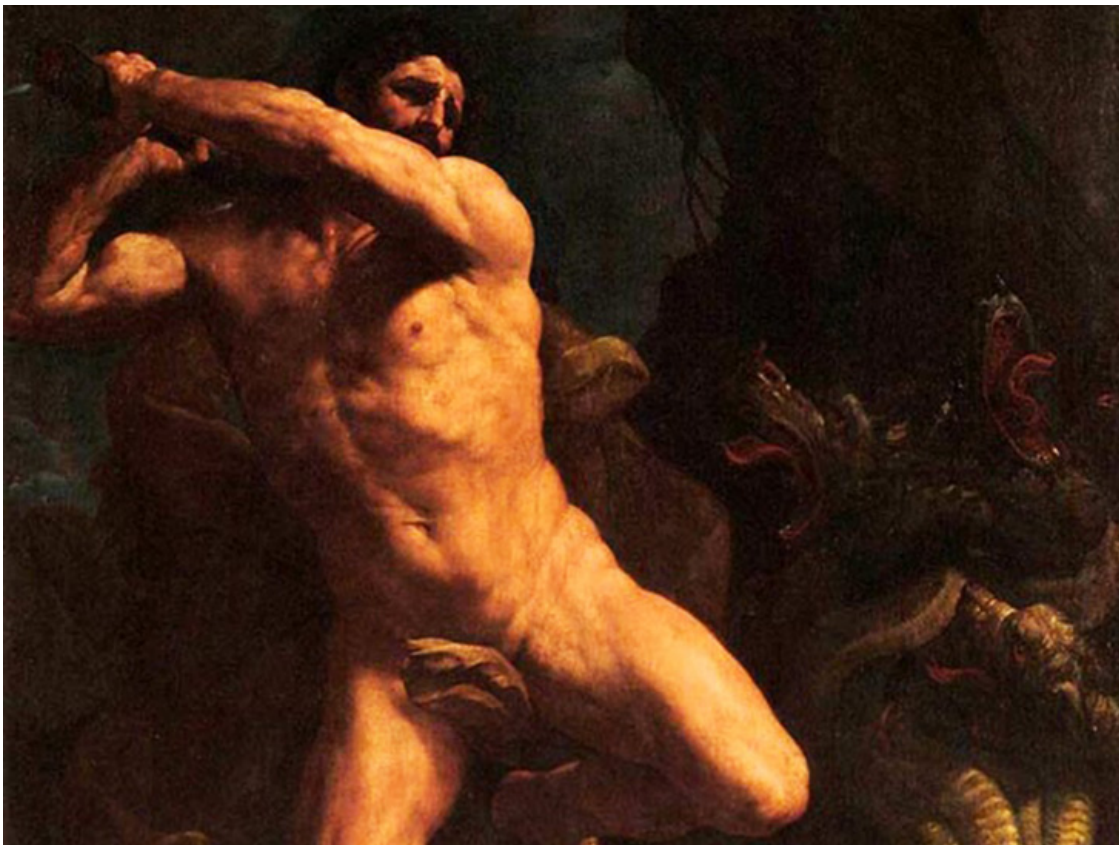
Лернейская гидра (второй подвиг Геракла)

Говоря о врачевателях античности, нельзя не упомянуть и Геракла. Он, конечно же, воин, однако существует мнение, что описанные в мифах события следует читать между строк. Это, впрочем, не сделает Геракла врачом, однако позволит увидеть, что он также внес свой вклад в медицину в сферу, так сказать, поддержания общественного здоровья. В качестве примера можно привести убийство Гераклом Лернейской гидры.