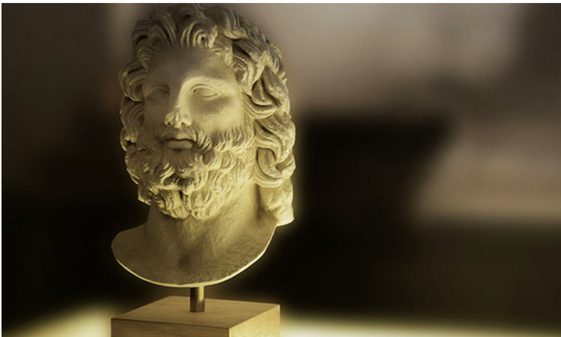
Асклепий.

Одно из первых упоминаний о дарующих исцеление божествах встречается у Гомера. Описывая знаменитые баталии у Трои, античный мудрец рассказывает в своем труде о боге медицины Пaeоне, который лечил как своих побратимов богов, так и простых смертных. В «Иллиаде» Гомера также можно встретить знакомое сегодня практически каждому имя Асклепия . Правда, во времена Троянской Войны он еще не являлся богом медицины. На тот момент Асклепий – простой смертный, который отправляет своих сыновей Махалона и Подарилиуса принять участие в легендарном противостоянии в качестве полководцев и врачей. Лишь несколько веков спустя последователи Махалона и Подарилиуса возведут их отца на Олимп (во всех смыслах этого слова), сделав его божеством медицины.