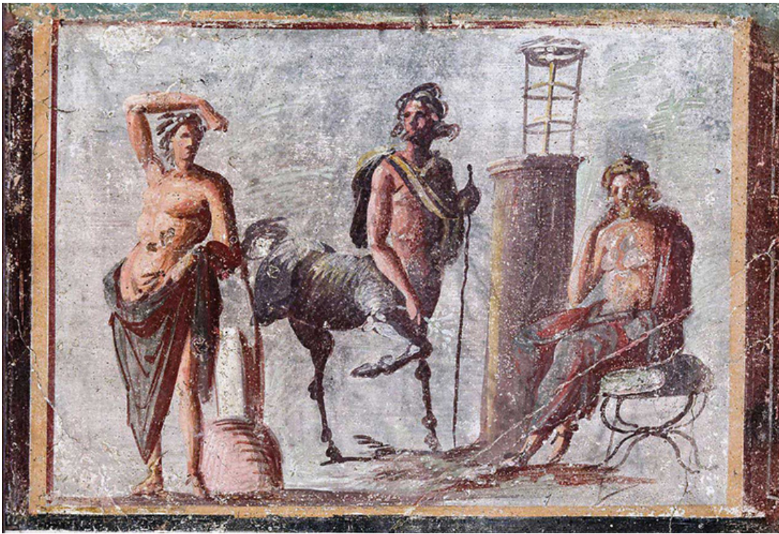
Асклепий, Аполлон и Хирон.

Среди последних числится и сам Аполлон , поручивший мудрому кентавру наставничество над своим сыном Асклепием, который впоследствии превзошел учителя в лекарском искусстве.