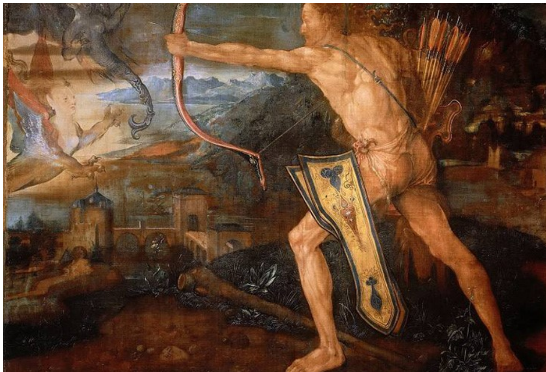
Стимфалийские птицы (третий подвиг Геракла)

Аналогичный результат дал и другой подвиг Геракла, связанный с уничтожением Стимфалийских птиц, которые представляли из себя распространявших малярию комаров. Кроме того, нельзя не обратить внимание и на тот факт, что в Афинах (особенно в годы Пелопоннесской войны – 431-404 до н.э.) мифологического героя почитали как божество медицины.