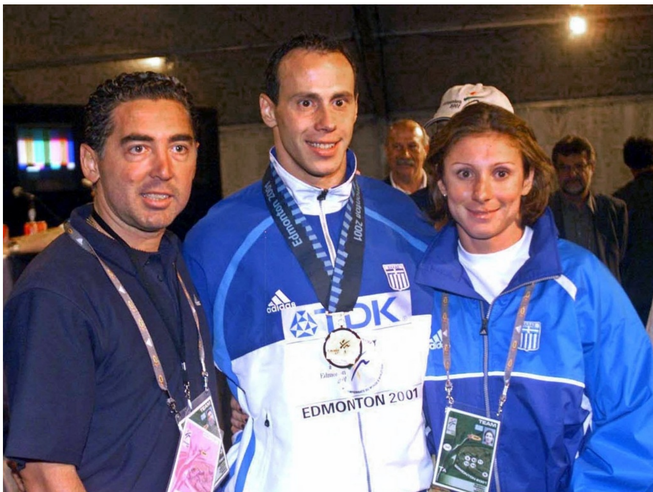
Костас Кендерис-Катерина Тану на Чемпионате мира по легкой атлетике в Канаде, 2001 год.