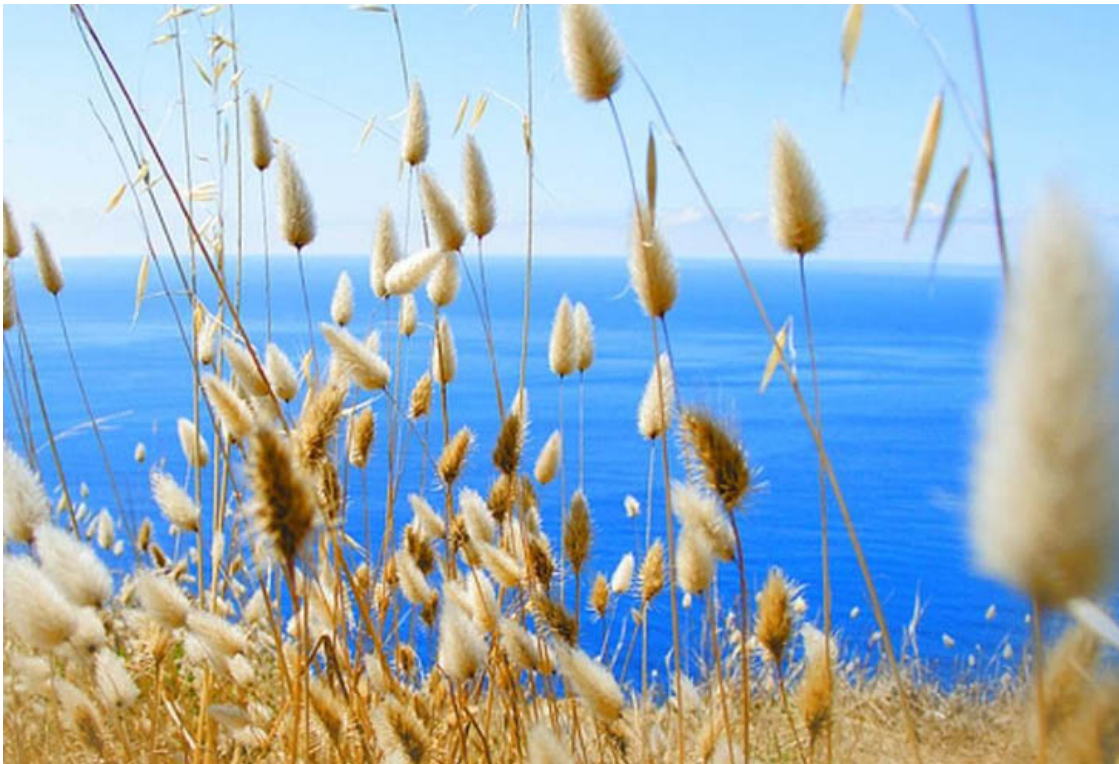
Лето в Греции

Горные районы, такие как Пинд и Олимп, создают более разнообразные климатические условия. Зимой здесь выпадает снег, что делает эти регионы привлекательными для любителей зимних видов спорта. Летом горы дарят прохладу, отличаясь более умеренными температурами по сравнению с низменностями.