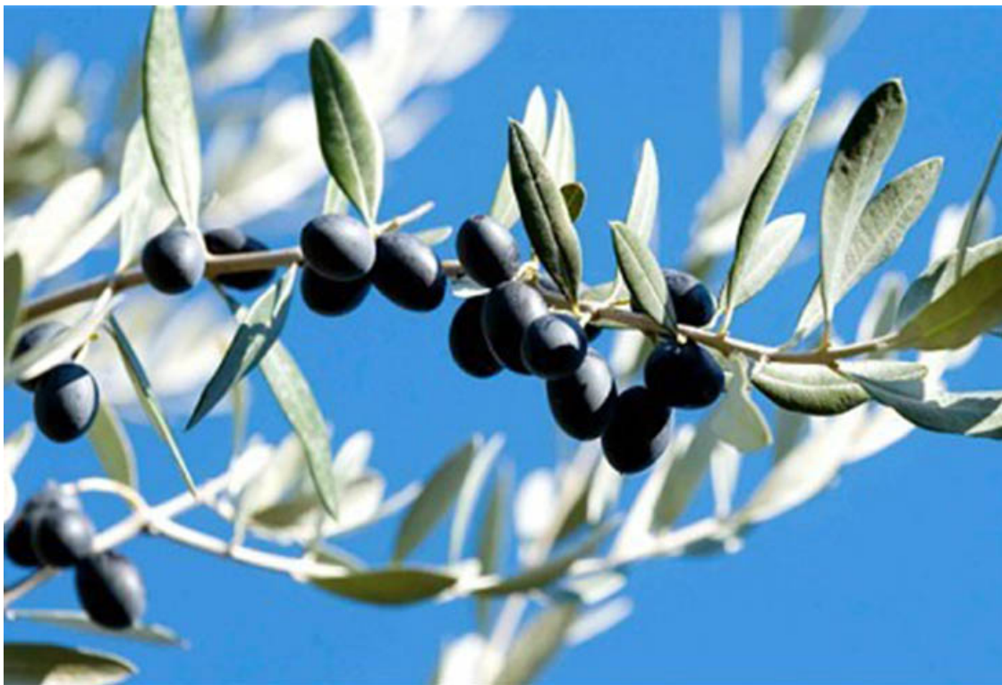
Осень в Греции.