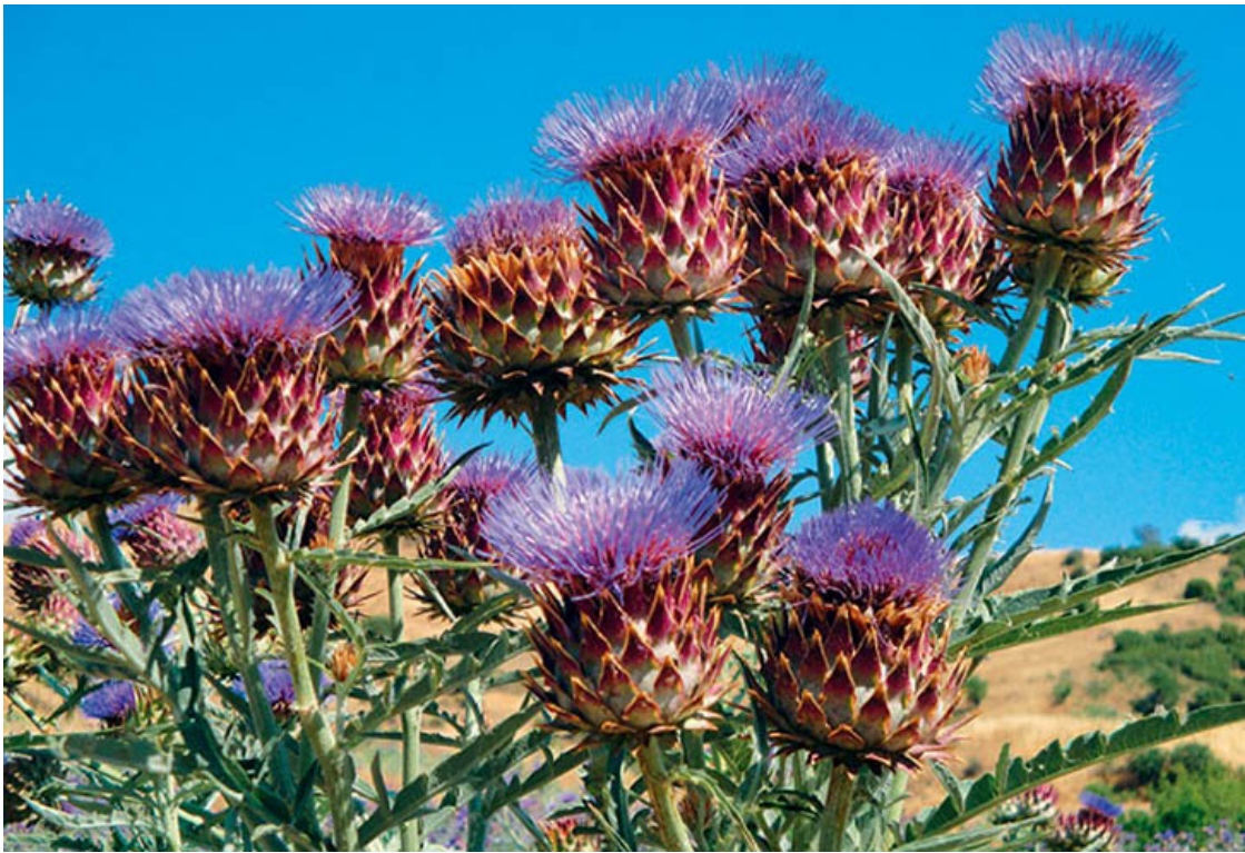
Весна в Греции.