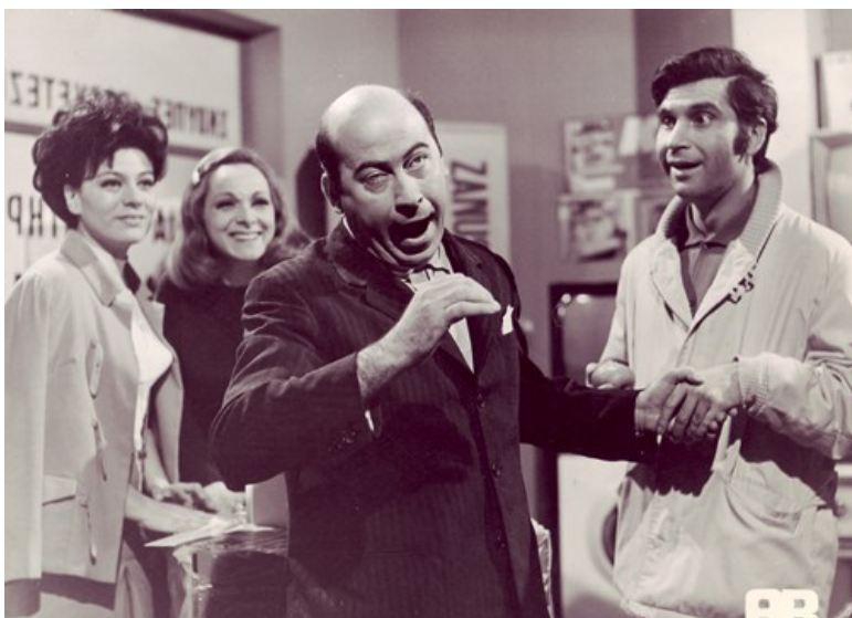
Танассис Венгос в фильме «Какой еще Танассис?»

В 1979 году, если я не ошибаюсь, в Москве прошел первый небольшой Фестиваль греческого кино. Неведомые до того момента греческие киноленты приехали в Москву сразу после исторического первого официального визита премьер-министра Греции (тогда им был Константинос Караманлис) в СССР.