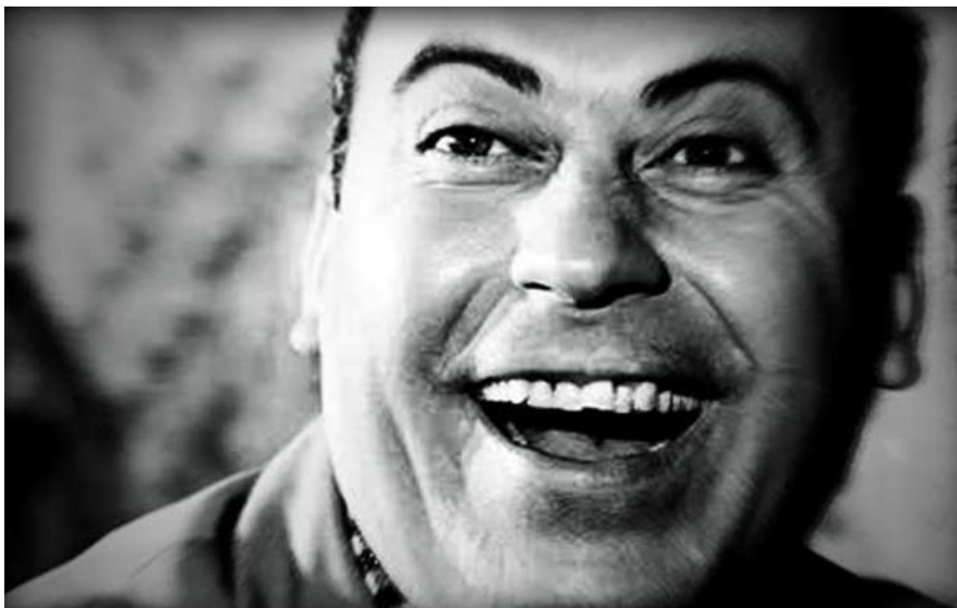
Танассис Венгос.

Танассис Венгос родился в Пирее в 1927 году. В порту, рядом с которым разбили свои лагеря семьи беженцев из Малой Азии. Эдакий Вавилон, город-базар, город портовой бедноты.