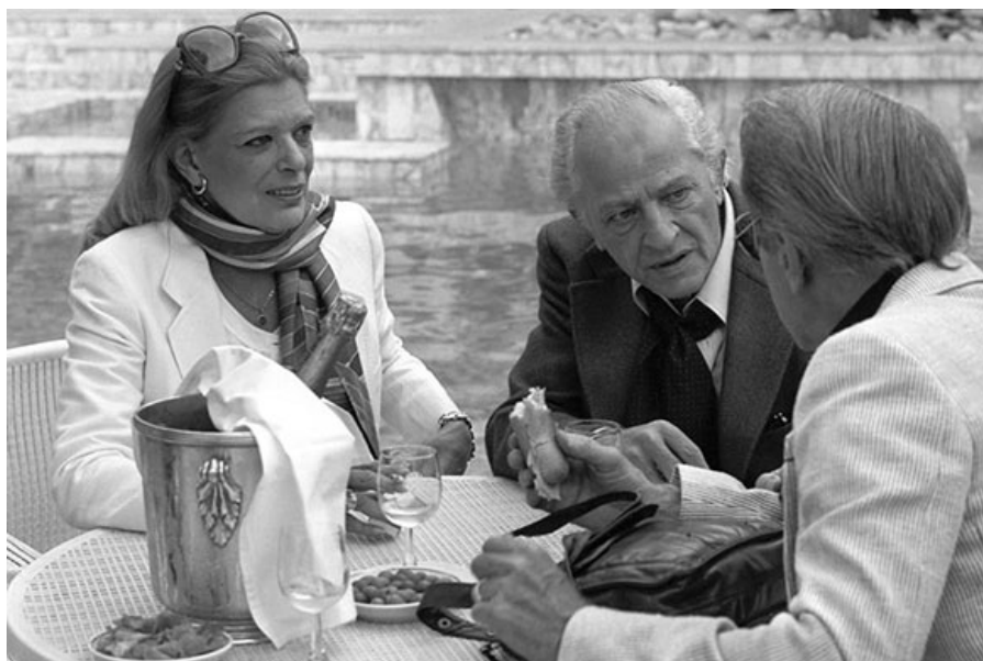
Мелина Меркури и Жюль Дассен

В 1944 году Мелина окончила Драматическую школу Национального театра и сыграла свою первую роль на его сцене – Лавинию в пьесе О’Нила «Электре подобает траур». Но настоящие овации пришли к ней, когда она сыграла роль Бланш Дюбуа в «Трамвае желаний» Теннесси Уильямса. С этой ролью ее долго будут ассоциировать, как в Греции, так и в Америке.