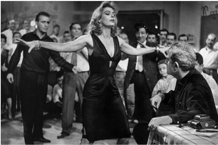
Мелина Меркури в фильме «Никогда в воскресенье»

Такой, какой она была в «Никогда в воскресенье» Мелина навсегда и запомнилась.