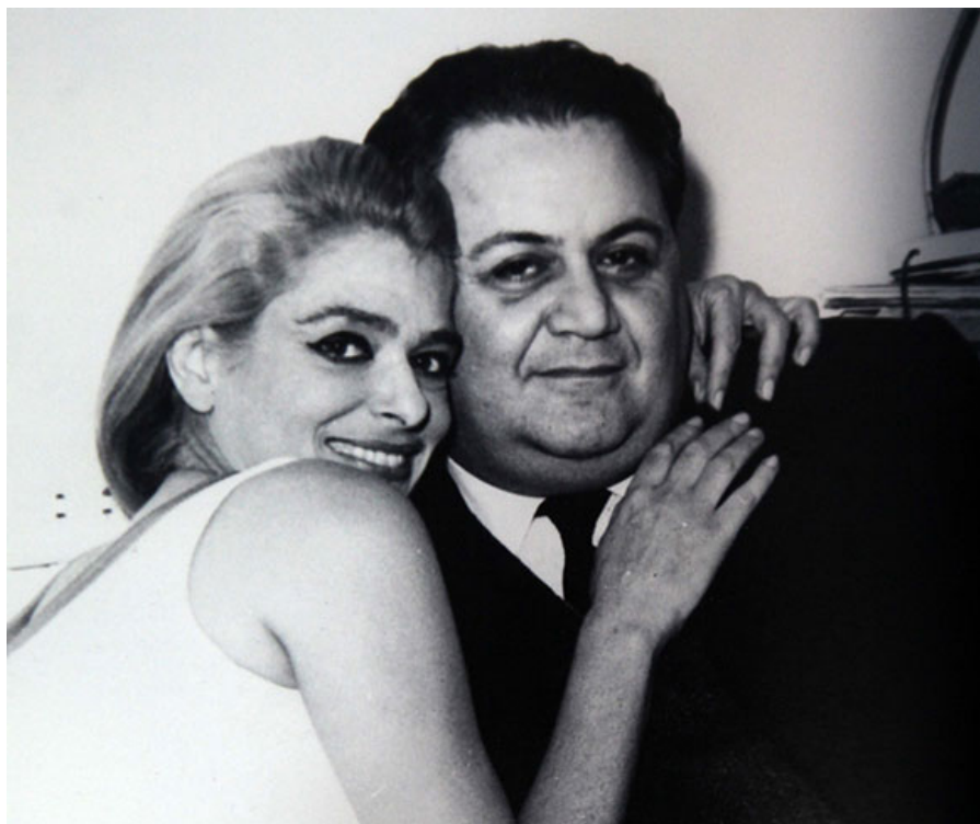
Мелина Меркури с Маносом Хадзидакисом

Несмотря на полный аншлаг, Жюль Дассен, режиссер и сценарист фильма, не получил в 1960 году в Каннах «Золотую пальмовую ветвь», зато Мелина разделила первую премию за исполнение первой женской роли с Жанной Моро. В 1961 году фильм станет кандидатом на целых пять Оскаров – сценария-режиссуры, первой женской роли, костюмов для черно-белого фильма, и музыки.