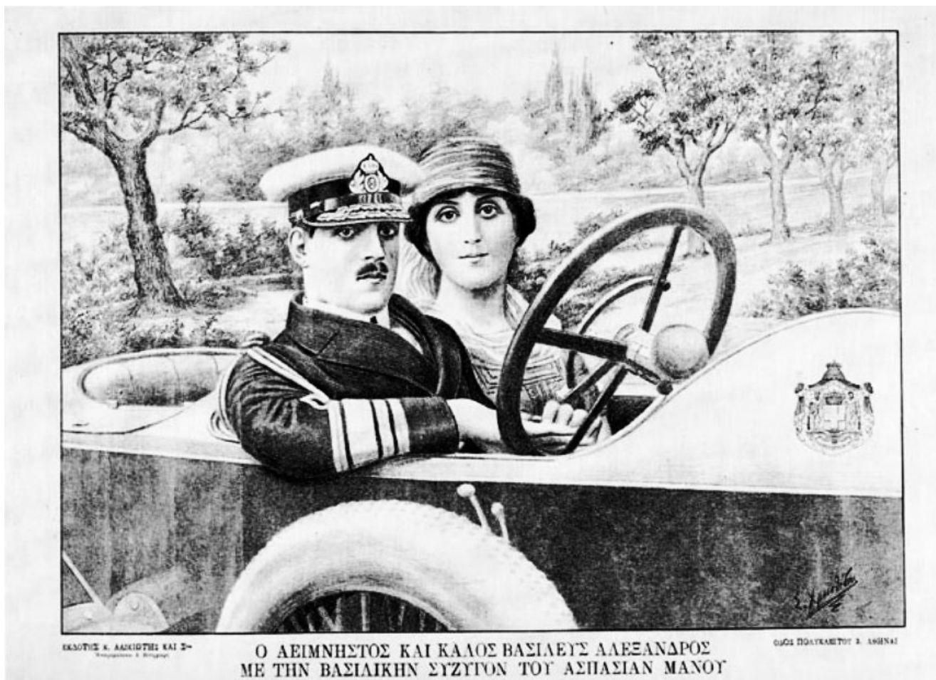
Король Греции Александр Первый со своей женой, Аспазией Ману, рисунок в журнале эпохи.

Однако, счастью Александра боги отмерили срок. 30 сентября 1920 года Александр приехал на королевскую дачу, в семейное имение Татой. Победитель в Первой мировой войне, молодой счастливый муж и без пяти минут отец любил прокатиться с ветерком на новом, начищенном до блеска «Пакаре», на заднем сидении которого по обычаю восседал подарок английских союзников Фриц, чистокровная овчарка. С Фрицем король никогда не расставался, любя его, как жаловалась Аспазия, чуть ли не наравне с ней.