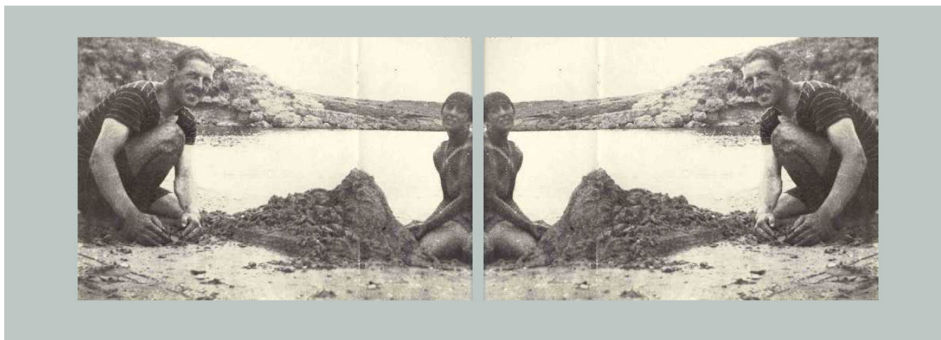
Король Греции Александр Первый со своей женой, Аспазией Ману на каникулах на острове Спецес.