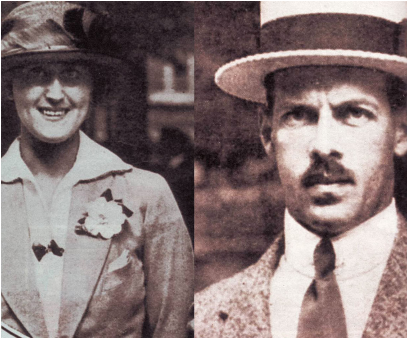
Король Греции Александр Первый со своей женой, Аспазией Ману.

На трон Александр взшел 30 мая 1917 года, в самый разгар Первой мировой войны, буквальным образом, по распоряжению Антанты! (Параллель с днем нынешним будет здесь вполне уместна...)