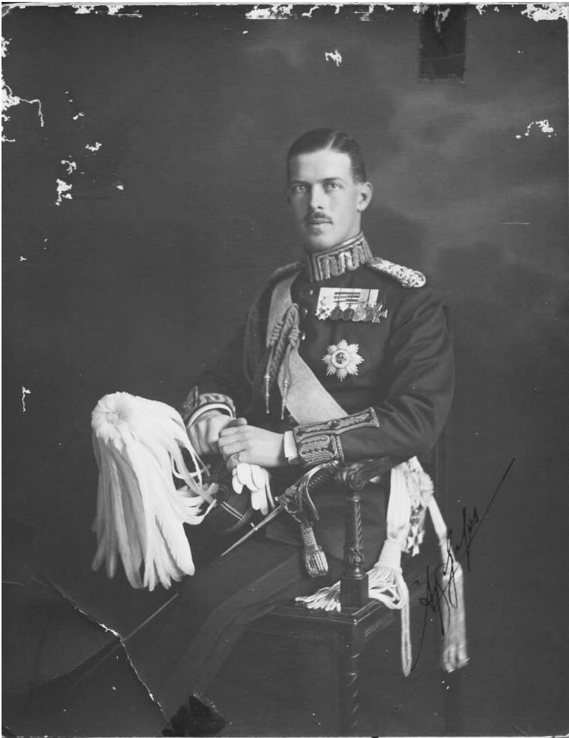
Король Греции Александр Первый.

Но вот случилось так, что 24-х лет от роду, 12 июня 1917 году, ему пришлось надеть греческую корону – и это при живом-то отце-короле и живом брате-наследнике. Пролетарствовал справедливый красавец Александр лишь три года, тяжелейших для Греции, ввязанной в Первую мировую войну, женился по любви на обыкновенной девушке, не королевских кровей, которую королевская семья и признавать не хотела, и умер 12 октября 1920 года, в 27 лет, от укуса обезьяны в своем собственном дворце, так и не успев подержать в руках свою дочь Александру, родившуюся пять месяцев спустя после его смерти.